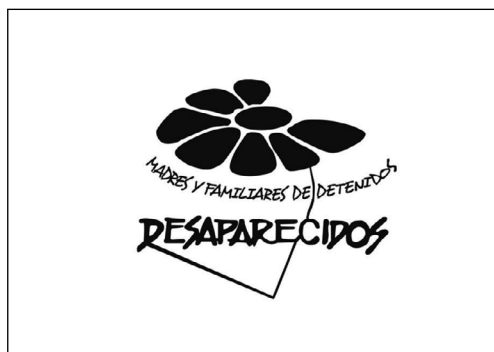
Figura 1. Logotipo de la organización Madres y Familiares de Detenidos Desaparecidos