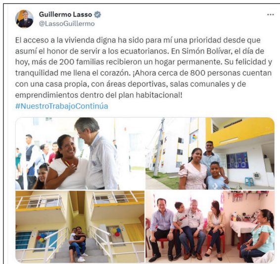
Figura 6. Representación de liderazgo y acción (variables “tipo de lenguaje” y “tono del mensaje”)