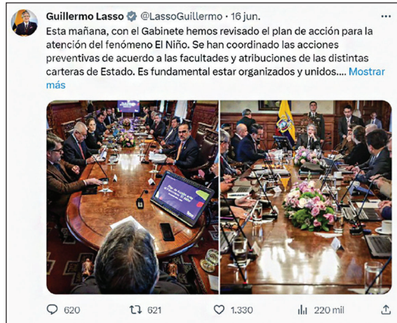
Figura 5. Representación de la iniciativa (variable “tipo de lenguaje”)