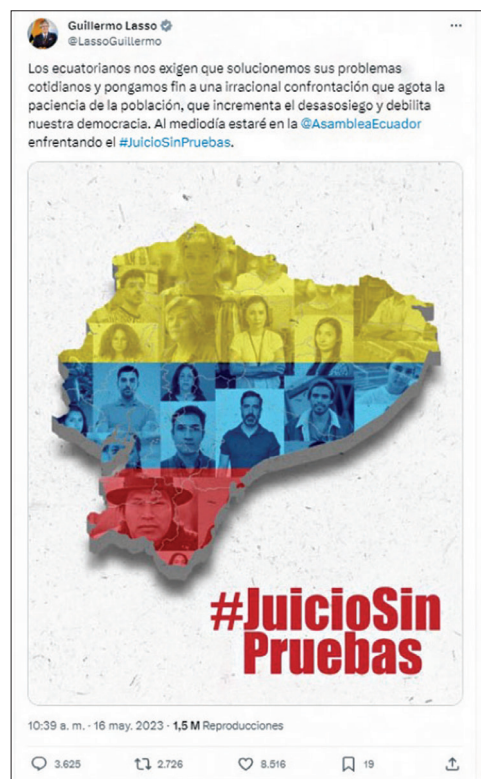
Figura 1. Estrategia de ataque al adversario político (variable “tono del lenguaje”)

Durante la intervención de Lasso por el juicio político, identificamos una estrategia de ataque a la oposición. El expresidente se refiere a una “acusación absurda de un grupo opositor que no entiende de verdades, de justicia ni de democracia” (Lasso 2023a), incluso desconociendo que se trata de autoridades electas (asambleístas) y que el juicio político es una medida constitucional de fiscalización (figura 1).