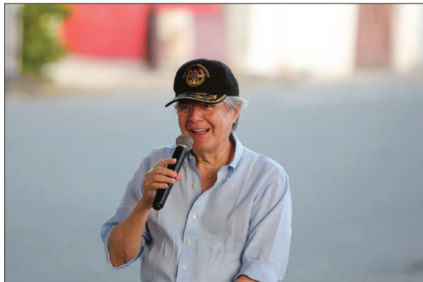
Figura 7. Autorrepresentación del líder como héroe (variable “imagen”)

Este giro también se observa en la imagen hollywoodiense de sí mismo que ha mantenido constante durante su gobierno y que retoma tras la convocatoria electoral: