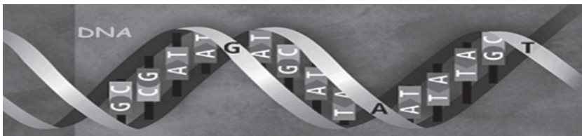
Figura 2 Cadena de AND – Genoma Humano

Así se logra un lenguaje formal en la ciencia, en la que se genera una nomenclatura básica y un sistema de relaciones que permiten traducir realidades simples o complejas. Un lenguaje científico que permite entendernos en un mismo idioma sobre los mismos fenómenos. Los ejemplos simples que se colocan en este trabajo, pero solo buscan poner en escena elementos generales de la formalización en diferentes áreas. En biología, por ejemplo, para explicar una realidad compleja como la del genoma humano se realiza una formalización en la que se puede mirar su conformación.