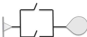
Figura 3 Ejemplo de un sistema disyuntivo

(El conector superior representa a p y el conector inferior representa a q)