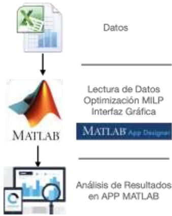
Figura 3. Proceso de interfaz

En la Fig. 3 se muestra la interfaz que se usa para la toma de datos de Excel, problema de optimización MILP e interfaz gráfica mediante un aplicativo en el software Matlab.