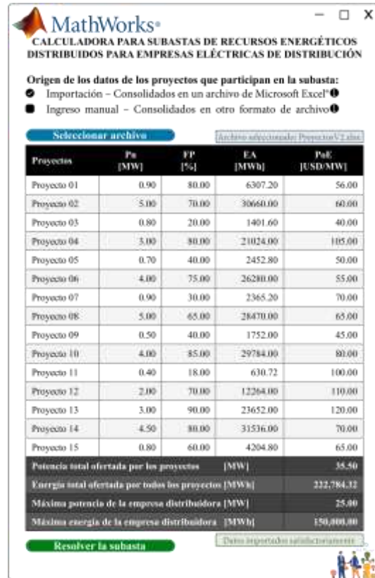
Figura 4. Datos en el Aplicativo de Subasta

En la Fig. 4 se muestra los datos en el aplicativo creado en Matlab, el cual permite importar los datos desde un archivo Excel, o pueden ser ingresados manualmente. Mediante el botón “Resolver la subasta” se inicia la resolución del problema de optimización lineal entero mixto.