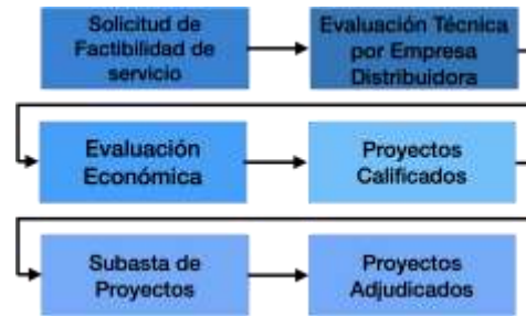
Figura 1. Procedimiento de Subasta

Considerando las premisas del numeral anterior se establece el procedimiento en la Fig. 1.