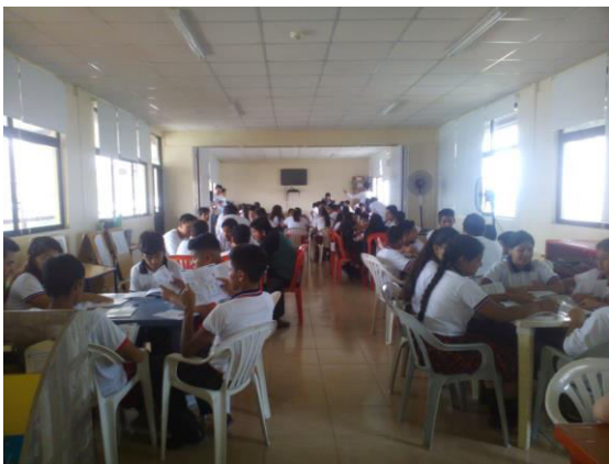
Figura 9. Ciclo de Formación U.E. Esteban Cordero - Fe y Alegría

La interacción con las tres unidades Educativas (Esteban Cordero de FE y Alegría (Fig.9) , PCEI Eugenio Espejo (Fig.10) y Adalberto Ortiz) ha permitido el levantamiento de la línea base del nivel cultural socio-energético a partir del análisis de los hábitos de consumo energético y las variables que el estudiante conoce en su entorno. No se consideran las variables climáticas, infraestructura o económicas que involucren una capacitación previa, lo cual podría repercutir en el alcance del proyecto piloto [6].