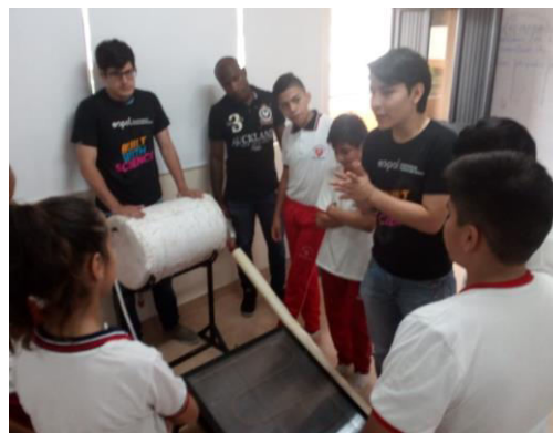
Figura 12. Módulo de Energía Solar Térmica

Los primeros ciclos de capacitación en relación al tema de energías renovables, se han realizado en las unidades educativas PCEI Eugenio Espejo y Esteban Cordero-Fe y Alegría, con un total de alumnos capacitados de 290 estudiantes.