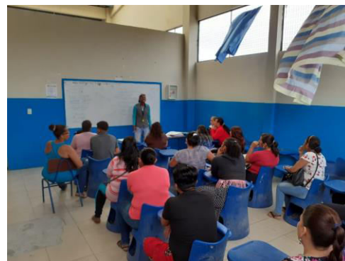
Figura 11. Charlas con padres de familia. U.E. PCEI Eugenio Espejo