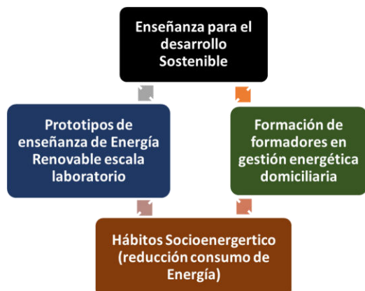
Figura 2. Modelo de Trabajo Propuesto

En esta etapa se establecen los contenidos mínimos que formarán parte del programa de capacitación y de formación para los estudiantes de los colegios y además del diseño un curso en formación de formadores en el campo de la Sostenibilidad Energética, para los estudiantes de la carrera de Ingeniería Mecánica, los cuales actuarán como facilitadores y/o formadores en las unidades educativas. El modelo planteado se basa en el esquema que se muestra en la Fig. 2.