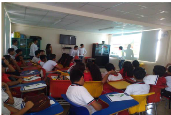
Figura 5. Escenario FGED

Finalmente, se estableció utilizar dos escenarios como estrategias dentro del proceso de enseñanza aprendizaje. El primero con una duración de 10 horas, denominado Formación de formadores en gestión energética domiciliaria (FGED), con el fin de fortalecer las habilidades relacionadas a la gestión de energía acorde al contexto local de la sociedad. y el segundo con una duración de también de 10 horas asociado a la Capacitación en temas de energías renovables por medio de equipos y módulos móviles. Fig. 5 y Fig. 6.