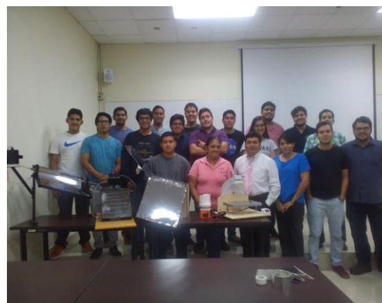
Figura 4. Presentación de Prototipos

Posteriormente, con la guía de un profesor de la carrera realizan el diseño, desarrollo conceptual y elaboración de prototipos portátiles de enseñanza de sistemas de energía renovable y módulos de iluminación residencial. Estos prototipos serán empleando como equipos móviles de laboratorio y formarán parte de las estrategias de enseñanza a aprendizaje a utilizar dentro de los colegios.