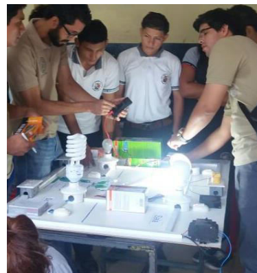
Figura 10. Ciclo de Formación U.E. PCEI Eugenio Espejo

Es importante mencionar, que la ejecución de cualquier proyecto enmarcado al fomento del desarrollo sostenible deberá tener un involucramiento de todos los actores sociales dentro del entorno de actuación, por tal razón dentro de las actividades que se planifican en las unidades educativas incluye una charla con los padres de familia como parte del proceso de transferencia de conocimiento. (Fig. 11).