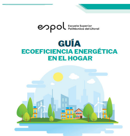
Figura 7. Manual de Ecoeficiencia en el hogar

En la práctica, la guía de Eficiencia Energética se emplea como recursos de formación estudiante-comunidad y también como libro de trabajo para las actividades de aprendizaje en los hogares. En la Fig. 7 y Fig. 8, se presentan los portados del material impreso utilizado.