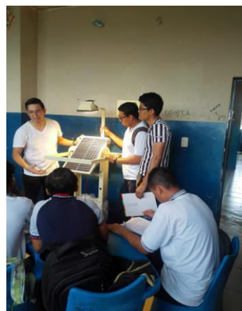
Figura 13. Módulo de Energía Solar Fotovoltaica

Estos primeros ciclos de capacitación permitieron el perfeccionamiento de las herramientas y guías de trabajo por parte de los estudiantes de la ESPOL; asimismo permitió el desarrollo de competencias asociadas a la enseñanza para el desarrollo sostenible en relación directa al ODS 7.