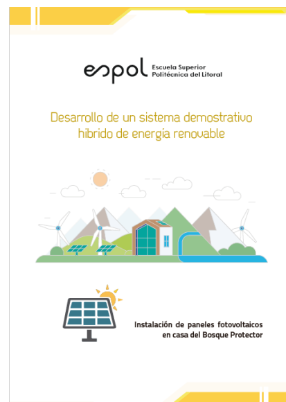
Figura 8. Guía del Sistema Demostrativo de Energías Renovables