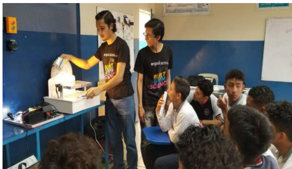
Figura 6. Escenario Capacitación EERR