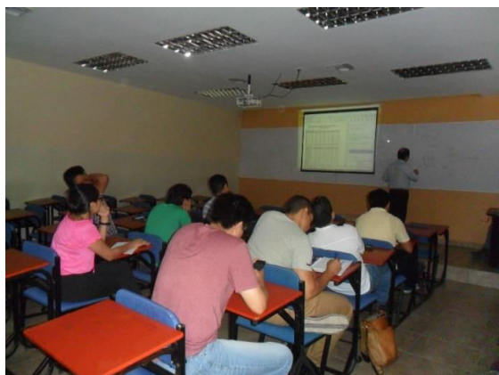
Figura 3. Capacitación y Refuerzo de Competencias

Del mismo modo, se realiza un refuerzo en las Herramientas de colaboración y conversación por medio charlas y trabajo grupales en gestión y ahorro energía, pues bien, el modelo de gestión energética incorporara la realización de actividades compartidas entre los estudiantes de la ESPOL; en su proceso de formación y previa a la capacitación que realizaran con los alumnos del centro educativo. Fig. 3.