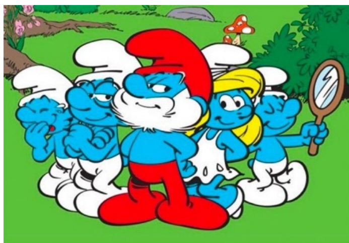
Figura 5. Papá Pitufo y los Pitufos

unas medias rojas. Lo común que tienen estos personajes es el color azul de sus corporalidades, porque aunque son muy parecidos entre sí, cada uno tiene un rol y unos rasgos predominantes en la comunidad que habitan. Así encontramos a Pitufos que desempeñan diversos papeles u oficios distintivos, en su mayoría asociados a la masculinidad. Por ejemplo, pitufo goloso, gruñón, dormilón, filósofo, labrador, fortachón, tontín. Pero también hay un personaje femenino que es la Pitufina; y un personaje infante que es Bebé pitufo.