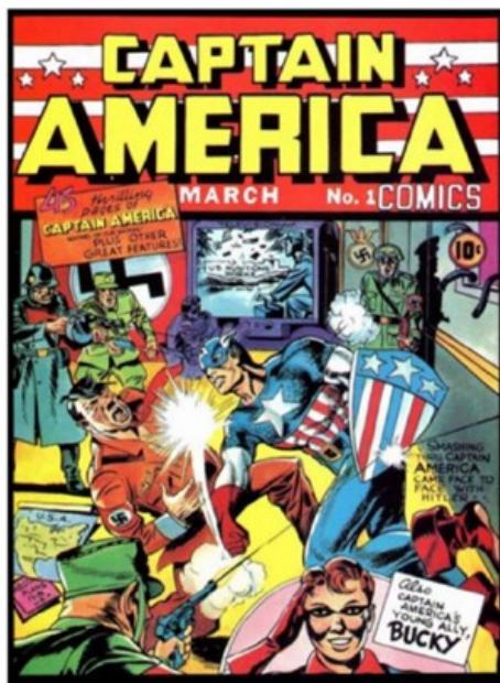
Figura 4. El Capitán América. Portada del ejemplar N°1.

golpeando a Adolf Hitler (antagonista),y aunque los autores temían que no funcionara, las ventas fueron exitosas con una gran acogida entre el público (Del Rosario, 2016).