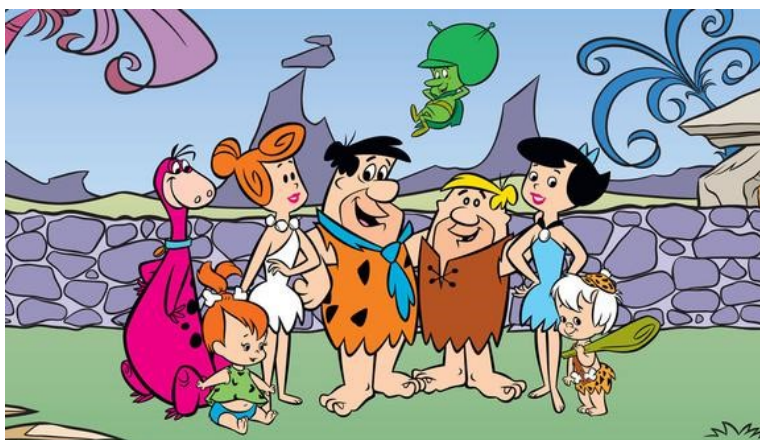
Figura 7. Personajes de los Picapiedra, Familia Picapiedra y Familia Mármol

Para el caso de Los Picapiedras, en la figura 7, se trata de una serie de origen Estadounidense que data del año 1966, y que fue creada por William Hanna y Joseph Barbera, a quienes además se les adjudica la autoría de exitosos proyectos como Los Supersónicos, El Oso Yogy, entre otras animaciones que fueron transmitidas con mayor fuerza en Ecuador en la década de los 80's y 90's.