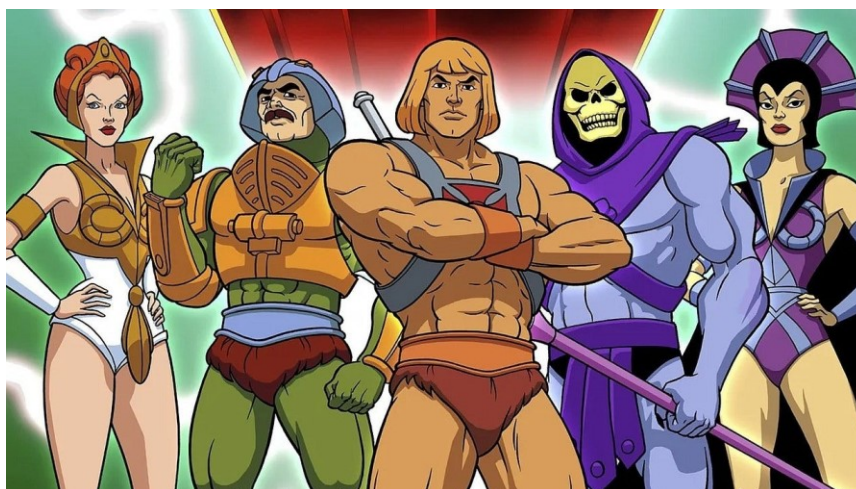
Figura 8. He-Man y los masters del universo

Nota. Imagen digitalizada de escena de la serie.