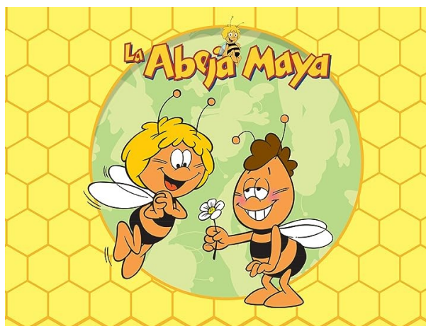
Figura 6. La Abeja Maya

La Abeja Maya, que aparece en la figura 6, de origen japonés es otra de las producciones destacadas, los papeles de género están dictados por un personaje jovial, amigable, capaz de estrechar lazos fraternos y solucionar problemas entre las diferentes especies animales que conviven en el cómic. Este personaje tiene un mejor amigo, Willie, quien la acompaña y escuda en sus aventuras. El papel de Maya expone un comportamiento prosocial, y resalta valores de la primera infancia: la cooperación, la solidaridad, el respeto, la empatía, la compasión y la aceptación.