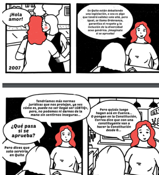
Figura 2. Cómico Queer Cuenca.

afrodescendientes, las mujeres indígenas, y otros grupos considerados de minoritaria representación social, y a quienes la estructura social y las interacciones tanto en las esferas públicas y privadas las invisibilizan (Morocho & Zambrano, 2023).