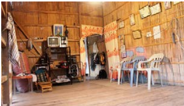
Figura 3. Interior de una casa típica de la región, estas suelen estar construidas de madera y caña y decoradas con diplomas.