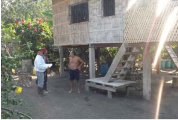
Figura 1. Observación in situ de la realidad sobre servicios básicos en la comunidad.