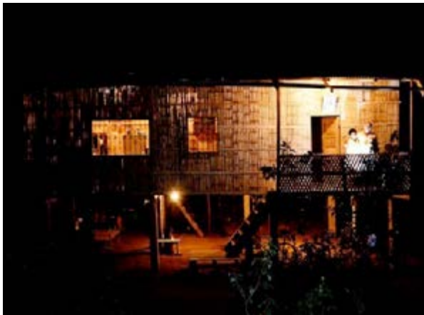
Figura 2. La electrificación es uno de los problemas que padecen en estas comunidades