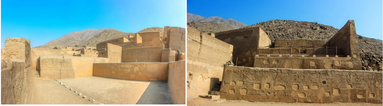
Figura 3. Palacio de Guayacán de Pariachi