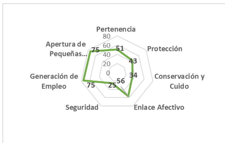
Figura 2. Desarrollo turístico: Valoración Social, Disfrute del Patrimonio, Impacto Económico.

Se muestra en el Figura 1, basado en la percepción de la población el 80% de los encuestados destaca que el Estado incentiva las actividades económicas vinculadas a la atención de los visitantes a la zona arqueológica. Sin embargo, en lo que se refiere a las políticas protección y preservación del patrimonio se percibe una baja participación del Gobierno. Así mismo el estado de la infraestructura del Palacio de Huaycán, la promoción de actividades para las visitas a la zona arqueológica es percibido como deficiente.