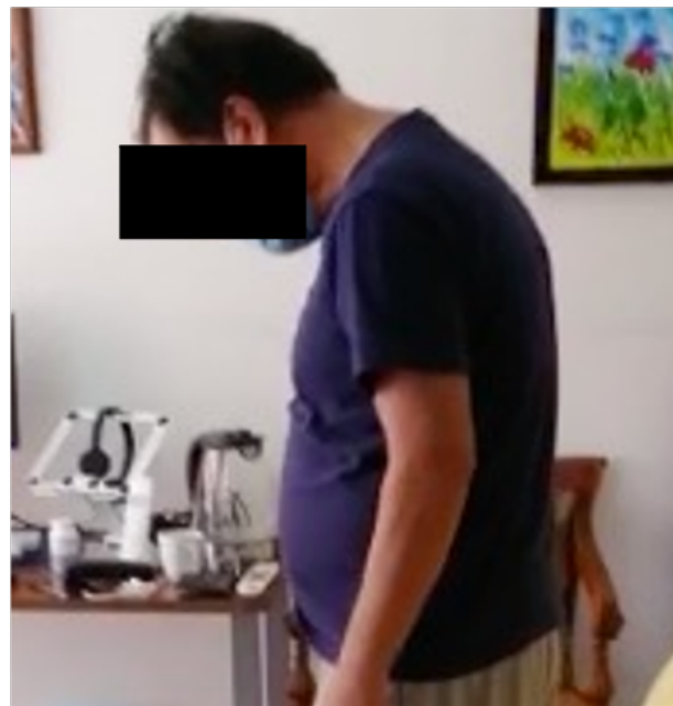
Imagen 1. Síndrome de cabeza caída. Se le pide constantemente al paciente que intente levantar la cabeza en diferentes maneras, sin embargo, no lo puede realizar.

Los hallazgos relevantes en la evaluación neurológica incluyen hipotrofia generalizada y debilidad localizada de los extensores del cuello, flexores del cuello, ambos deltoides y ambos infraespinosos. La fatigabilidad estaba presente después del esfuerzo y notó que la debilidad empeoraba por la tarde. Podía contar hasta