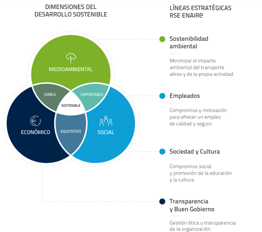
Figura 1. Dimensiones de la RSC