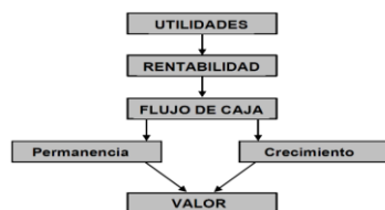
Figura No. 1: Secuencia de eventos que conducen a la generación de valor

En el proceso de generar valor empresarial, es vital definir las variables que se asocian con la operación de la empresa y que afectan directamente a su valor explicando la relación causa-efecto y el porqué de las fluctuaciones, estas se conocen como inductores de valor (García Serna (2003, p. 14)). Los inductores más destacados son: