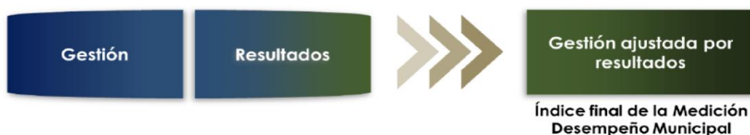
Figura 1. Estructura de nueva medición del desempeño municipal

El componente de gestión se define como las decisiones y acciones que perfecciona la administración pública para la consecución y movilización de los insumos del sector público, que están orientados a la mayor prosperidad de la urbe y el desarrollo social; la gestión está determinada por las cuatro dimensiones representadas en la Tabla 1 , que a través de variables