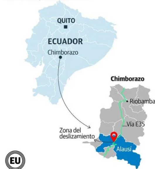
Fig. 4: Área de afectación por deslizamiento - Alausí