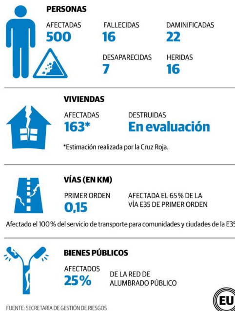
Fig. 5: Afectación por deslizamiento – Alausí

El deslave ocurrido en Alausí, Ecuador, el 26 de marzo de 2023 dejó al menos 16 muertos, 7 desaparecidos y varias viviendas sepultadas. Además, 22 personas resultaron damnificadas, 163 viviendas fueron afectadas, 16 personas resultaron heridas y la vía E35, que conecta la sierra con el sur del país, sufrió una afectación del 65%. El Servicio Nacional de Gestión de Riesgos de Ecuador informó que los equipos de bomberos de varias zonas del país trabajaron en las tareas de rescate junto a la Policía, las Fuerzas Armadas, la Cruz Roja y el Ministerio de Salud, entre otras entidades. El Gobierno informó que se han activado albergues temporales y el envío de kits de dormir para quienes los damnificados (Fajardo, 2023).