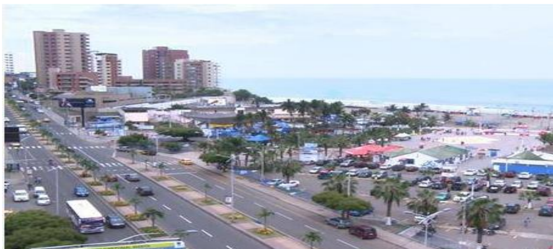
Figura Nº 2. Vista aérea de la ciudad de Manta, calles cuadrículas homogéneas, manzanas rectangulares de diversos tamaños

El plano de la ciudad regular carece de los elementos propios de otras ciudades latinoamericanas, como la plaza mayor o la iglesia. Las calles originales de la trama regular fueron prolongadas más allá de su original diseño, hasta ocupar toda la plataforma natural. (Llop y Vivanco, 2017). Esas calles rectas concluyen en las zonas donde cambia el relieve del suelo o en el área en el que la plataforma llana desciende hacia la costa.