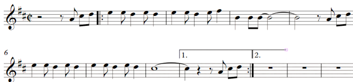
Fig. 5: El Teléfono (Pintura Roja 1976)