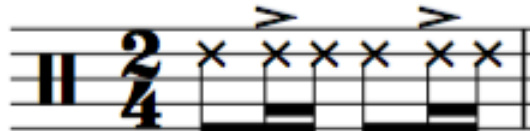
Fig. 4: Patrón rítmico de la cumbia peruana

Luego de analizar los patrones rítmicos observamos que el indicador de compás de la chicha es 2/4 y se trata de una semicorchea que lleva el acento en el contratiempo; a diferencia del patrón rítmico de la cumbia colombiana que el acento está presente en el tiempo fuerte de la corchea. El patrón rítmico de la chicha es el producto de la fusión que se da entre la cumbia colombiana y el huayno de la sierra central en los valles del Mantaro y Yanamarca, rítmica que