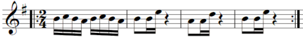
Fig. 1: Caminito Serrano (Los Destellos 1968)