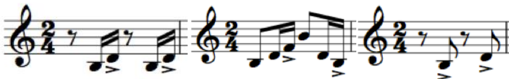
Fig. 3: Patrones rítmico-melódicos recurrentes del huayno de los Andes centrales