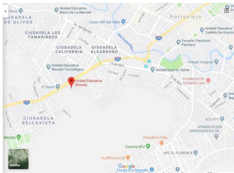
Fig. 1: Ubicación de la Unidad Educativa del Milenio Olmedo