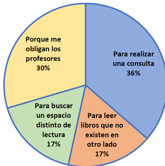
Fig. 3: Motivos para visitar la biblioteca