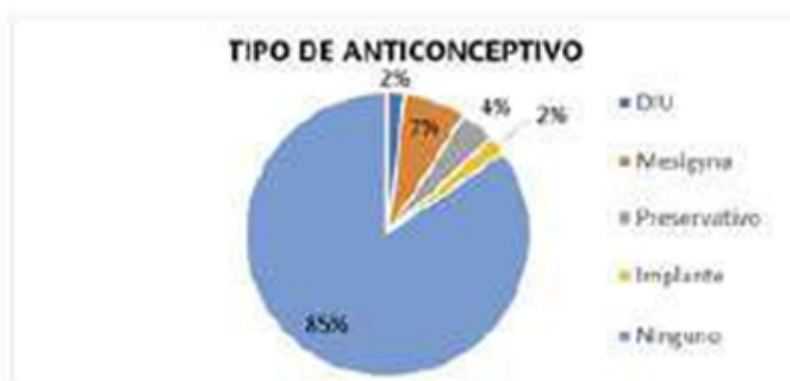
GRÁFICO 2. Anticonceptivos

Únicamente 11 pacientes (20,75%) de la población en estudio presentaron antecedentes de abortos previos y, además, se señala que las primigestas mostraron un rango elevado de 10 pacientes (18,88%), lo que nos permite deducir que no influye directamente en la predisposición de esta patología (tabla 4).