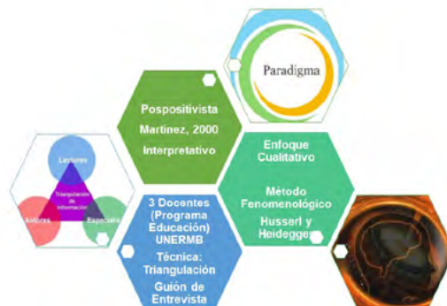
Figura 1. Entramado metodológico

El desarrollo de esta investigación se basó en un producto con enfoque cualitativo sustentado en Miguélez (2000), así mismo, un paradigma interpretativo y un método fenomenológico fundamentado en Heidegger (2006) y Husserl (1998), posteriormente se aplicó como instrumento la entrevista del tipo semiestructurado a tres (03) docentes del programa educación discriminados de la siguiente manera: uno de ciencias sociales, uno de ciencias pedagógicas y uno de práctica profesional.