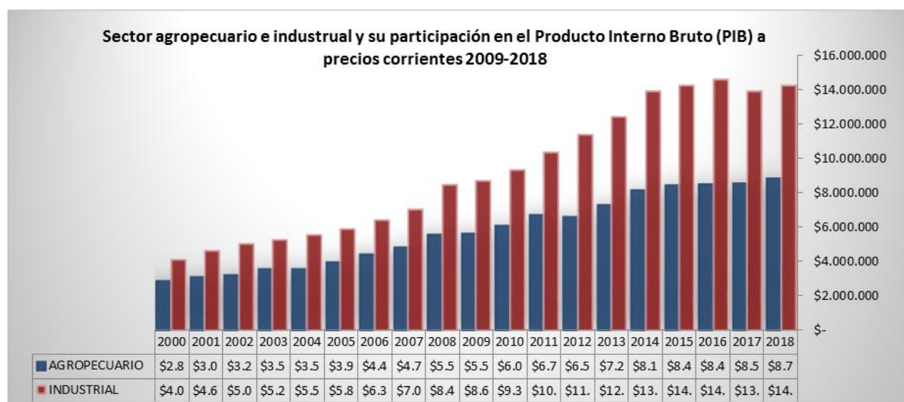
Figura 3: Participación del Sector Agropecuario e Industrial en el PIB periodos 2000-2018.