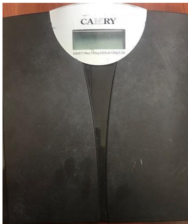
Figura 2.- Balanza utilizada para pesar a las cabras en kg.

La edad promedio de los caprinos es de 10 a 12 años, con buenas condiciones de vida y cuidado pueden llegar a vivir 15 a 18 años y su de producción varía de acuerdo a su raza, el tipo de explotación y alimentación, para conocer su edad hay que fijarnos en sus dientes y en los anillos de sus cuernos, en este estudio previamente realizamos una encuestas a los propietarios del ganado donde ellos manifestaron la edad de cada una de sus cabras, que fue corroborada con la inspección de la dentadura.