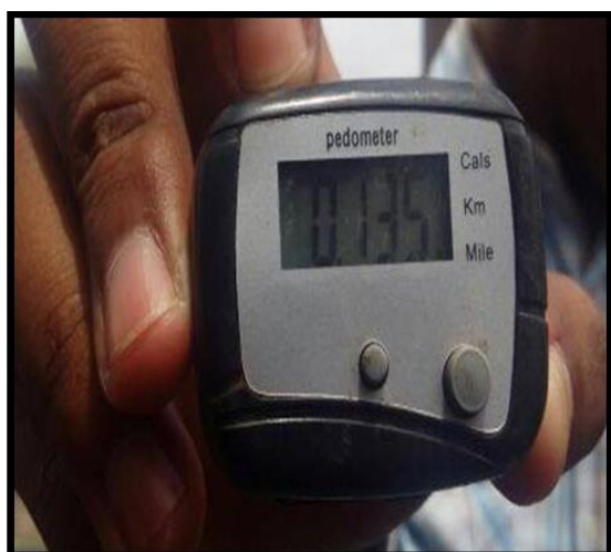
Figura 1.- Podómetro para medir los kilómetros recorrido por la cabra

Esta investigación permitió determinar el gasto energético involucrado en las caminatas que normalmente realiza cada caprino de la Península de Santa Elena; el muestreo se realizó desde julio hasta agosto del 2017, 60 animales evaluados en un periodo de 24 horas, en diferentes comunas de Santa Elena como Colonche, Villingota, Chanduy, San Vicente, Las Lomas, Río Seco, San Marcos, Julio Moreno. Para determinar el gasto energético se ubicó los podómetros o también llamados cuenta pasos, el artefacto tiene un sensor interno que es capaz de detectar el balanceo producido por cada paso efectuado, puede deducir aproximadamente distancias, velocidades y cadencias, suele emplearse para mediciones aproximadas en el rango entre 5 y 200 metros, dentro de sus especificaciones tienen un peso 17 g, tamaño 47x36x21mm, cuenta máxima de paso 99999, batería LR44 son equipos diseñados para la especie humana y con unas modificaciones se adaptaron el uso para los caprinos, se diseñaron unos sujetadores con velcro, correas sujetadoras de plástico y bolsas de polietileno ziploc para colocárselo en el miembro posterior, arriba de la rodilla del animal con la finalidad de medir la distancia, evitar su pérdida, que no sean mordidos ni retirados por las cabras en el tiempo que duró el ensayo.