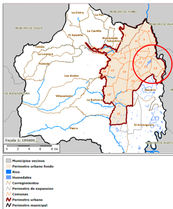
Figura 1: Mapa por comunas de la ciudad de Santiago de Cali, Colombia