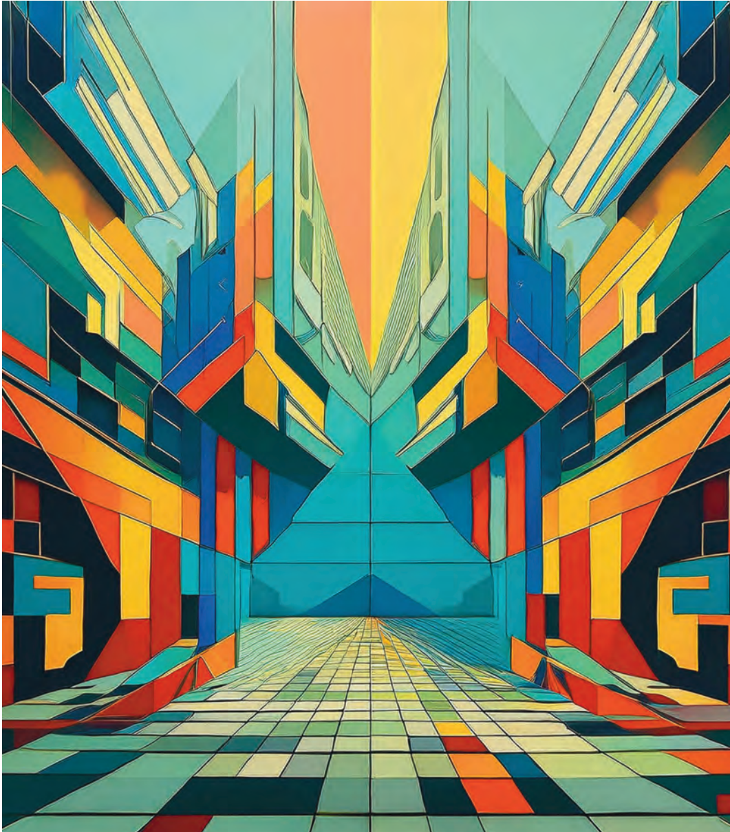
Imagen: generada con IA