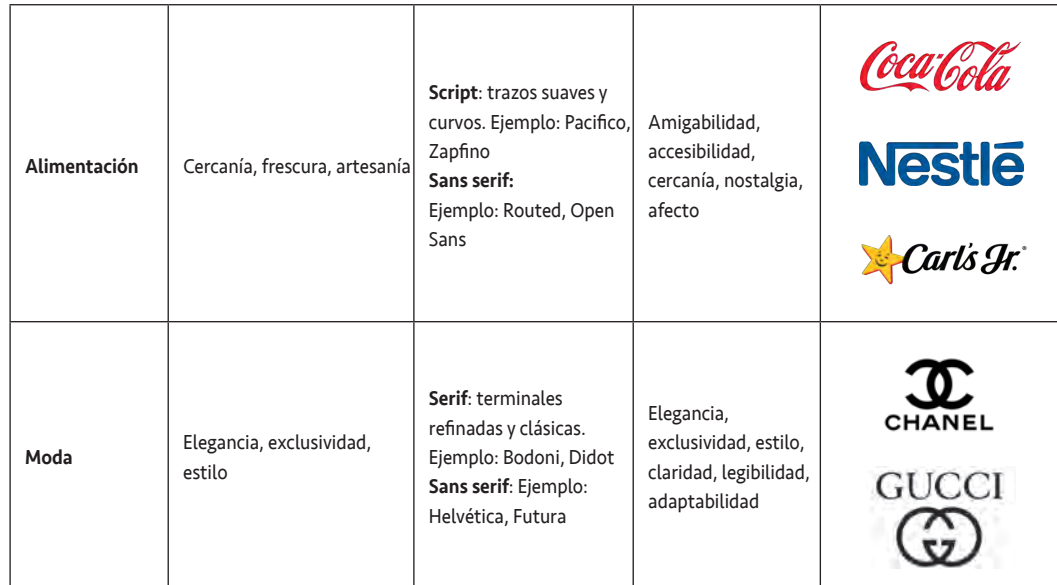
Tabla 1. Uso de tipografías en diferentes sectores de la industria (elaboración propia).