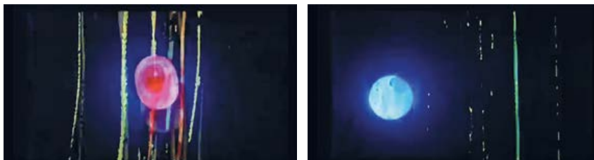
Figuras 4 y 5. Las imágenes sobre las cuales interviene el texto de Marta Dillon. Muestran un círculo luminoso, que se podría parecer a la luna (Restos, Albertina Carri, 2010).

¿Será posible recuperar su gesto desafiante, su potencia vital? ¿Su exquisito presente hinchado de futuro? ¿Podrán todavía mellar la trama que cubre el cielo de los rebeldes? El fervor de su ausencia quema. Ahora mismo" (Restos, 2010, 5'50"-6'27").