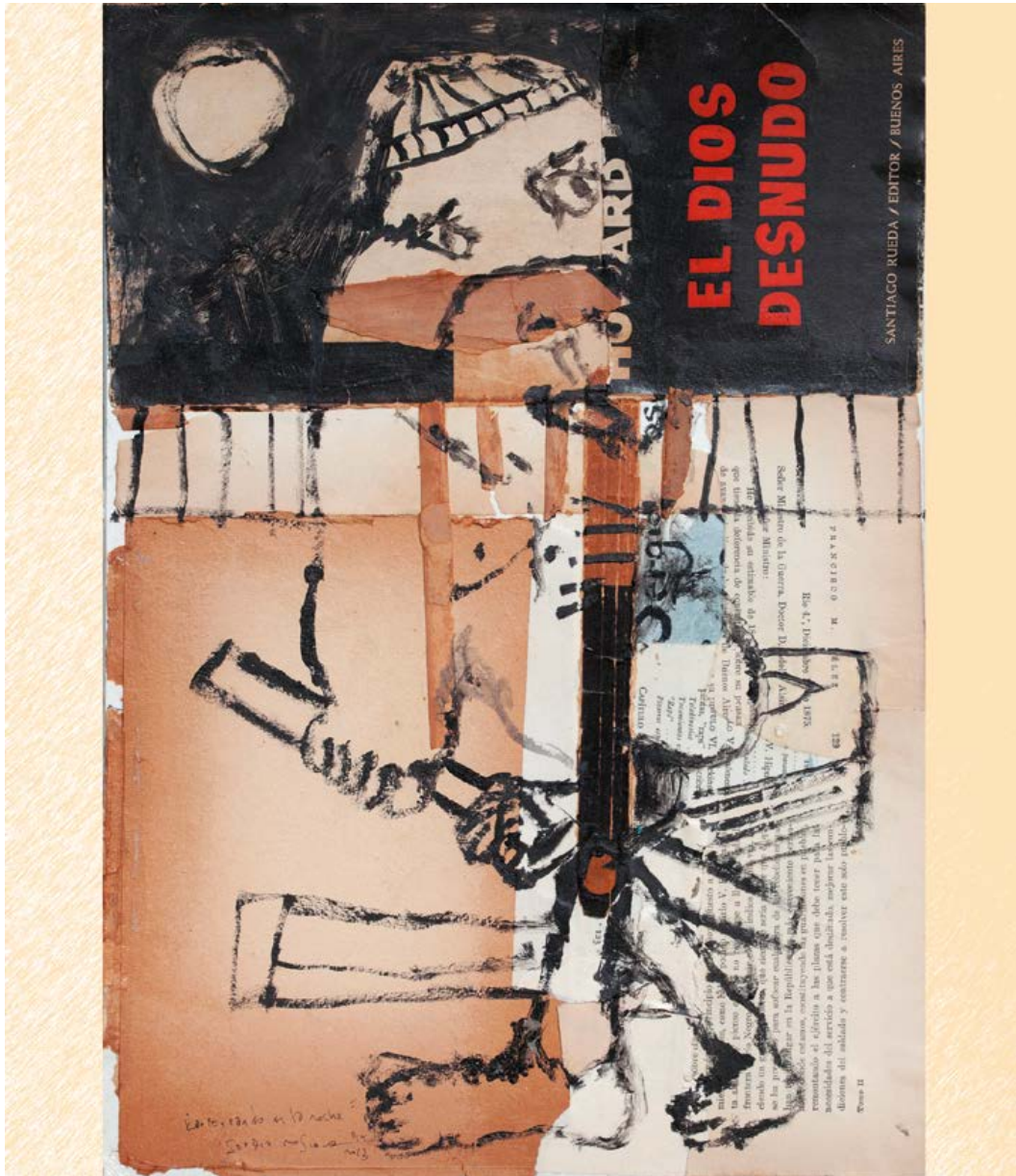
Imagen: Sergio Moscona