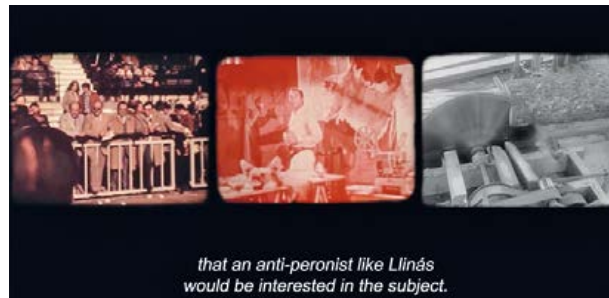
Figura 1. Carri usa en Cuaterros la técnica del split screen : la pantalla está dividida en varias partes iguales ( Cuaterros , Albertina Carri, 2016)

Cuaterros (Albertina Carri, 2016), película con la cual Carri vuelve al documental, está constituida exclusivamente por imágenes de archivo : es decir, no son imágenes filmadas con el objetivo de esta película. El origen de las imágenes es variado: found footage anónimo, fragmentos de películas argentinas olvidadas o noticieros oficiales. Por otra parte, todo el material está tratado de la misma forma, es decir: en una pantalla en movimiento (dividida por momentos en tres, cuatro o hasta cinco partes iguales; ver Figura 1) las imágenes desfilan acompañadas de la voz en off de Carri, libre de relación directa con lo que estamos mirando. En efecto, a primera vista, el sonido y la imagen parecen cada uno hermético al otro, a priori sin punto de encuentro. En realidad, se trata de una elección consciente: imágenes y sonido conformando un discurso pensado. Luego de unos minutos, las imágenes revelan el poder metafórico de la voz en off , que parece interpretar el archivo de manera poética, en el sentido que lo entiende por ejemplo Patrick Brun (2003, 41), pensador de las imágenes: “Hacer manar, entre [la imagen] y nosotros, una dimensión sensible, incluso visible, que nos restituye al mundo”. Según él: “No se trata de producir una imagen del mundo, sino de crear una presencia del mundo más allá de la imagen” (2003, 41) 6 .