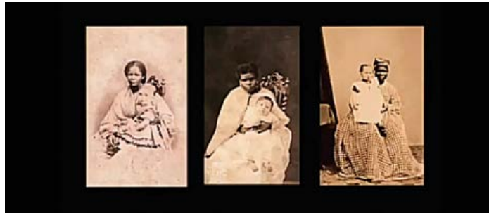
Figura 2. Fotograma de Babás (Consuelo Lins, 2010).

Pero aquello que identificamos como “lo fotográfico” no desaparece, una vez comenzado el relato. Todo el film está “enmarcado” por un borde negro, que a veces funciona a modo de caché al encerrar la imagen en movimiento, y otras veces solo la contiene desde los márgenes superiores e inferiores. En ningún momento la imagen fílmica aparece plena en la pantalla, ni se extiende totalmente hacia los bordes. El enmarcado, entiendo, también sirve para unificar los diversos tipos de imágenes (fotográficas, fílmicas, pictóricas, y aquellas tomadas de diarios o publicaciones gráficas) y pone en evidencia que miramos siempre desde algún recorte; nunca estamos frente a una totalidad.