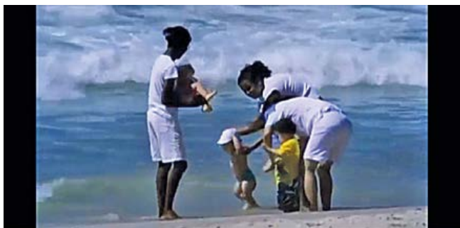
Figura 4. Fotograma de Babás (Consuelo Lins, 2010).

La distancia frente al objetivo también evidencia el lugar que toma la directora: una mujer blanca, perteneciente a la clase media e intelectual de Brasil. Esa particularidad del narrador impone marcas en el enunciado. La instancia enunciativa se reconoce como parcial y deja establecido desde dónde habla, señalando en ese gesto también sus limitaciones. Lins mira a las niñeras de lejos 2 .