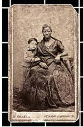
Figura 1. Fotograma de Babás (Consuelo Lins, 2010).

Pero aquello que identificamos como “lo fotográfico” no desaparece, una vez comenzado el relato. Todo el film está “enmarcado” por un borde negro, que a veces funciona a modo de caché al encerrar la imagen en movimiento, y otras veces solo la contiene desde los márgenes superiores e inferiores. En ningún momento la imagen fílmica aparece plena en la pantalla, ni se extiende totalmente hacia los bordes. El enmarcado, entiendo, también sirve para unificar los diversos tipos de imágenes (fotográficas, fílmicas, pictóricas, y aquellas tomadas de diarios o publicaciones gráficas) y pone en evidencia que miramos siempre desde algún recorte; nunca estamos frente a una totalidad.