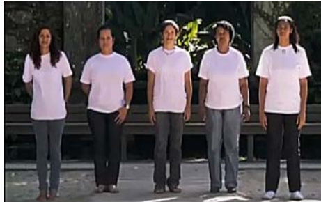
Figura 8. Fotograma de Babás (Consuelo Lins, 2010).

Brasil. Esa sencilla prenda de vestir se transforma en un “uniforme”, las consolida y distingue como trabajadoras, las expone como grupo antes que como sujetos particulares. Es mediante el uso de esa prenda (que relacionamos inmediatamente con las imágenes anteriores donde vimos a las niñeras vestidas de blanco) que se construye la idea de similitud, se niegan las diferencias y habilita pensarlas como un colectivo homogéneo, frente a la mirada de la cámara y como un grupo de empleadas, “las niñeras”, respecto a la directora.