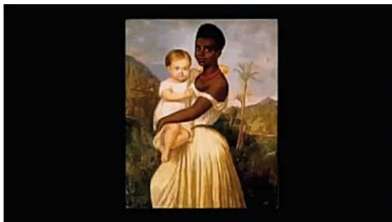
Figura 6. Fotograma de Babás (Consuelo Lins, 2010). Cuadro del emperador.