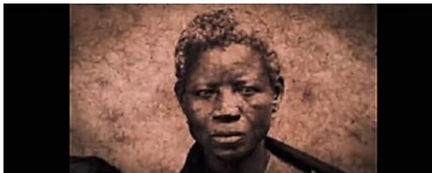
Figura 3. Fotograma de Babás (Consuelo Lins, 2010).

El film inicia con la cámara posada sobre el retrato fotográfico de una niñera negra. Inmediatamente, el cuadro se va abriendo y la imagen se va develando de a poco. La cámara de Lins se detiene en los detalles, funda una mirada nueva e íntima sobre ese documento, pone en evidencia que esa imagen no se ha observado lo suficiente, que no ha recibido la debida atención, mira, comenta, pregunta.