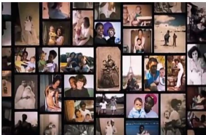
Figura 9. Fotograma de Babás (Consuelo Lins, 2010).

Este objeto articula, de manera sutil pero decisiva, el ámbito del film con el de la fotografía y con él se clausura el documental.