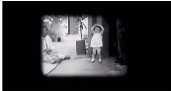
Figura 5. Fotograma de Babás (Consuelo Lins, 2010).

Sobre el límite del marco, fuera de foco, en segundo plano, esos parecen ser los espacios posibles que la fotografía y el lenguaje cinematográfico construyeron para albergar y poner en escena a las clases bajas y a las minorías raciales. Alcanzaría, en principio, identificar el lugar que ocupan esos cuerpos en la composición del encuadre para saber cuál es la clase social a la que pertenecen y qué peso tienen en la estructura social.