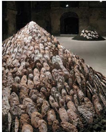
Figura 11. Cupí de cerámica (Rimer Cardillo, 2010).

Rimer Cardillo desarrolla instalaciones (Figura 11) en las que emergen los vestigios ruinosos y facticios de la fauna y la flora en vías de extinción. Comprometido con una dialéctica sobre el cuidado de la tierra, sus obras están plantadas en una ancestralidad tácita. En una serie de obras recrea los cupí (vocablo guaraní): túmulos gigantes que imitan los hormigueros típicos de cierta especie de Sudamérica que los charrúas imitaban para enterrar a sus muertos. Sobre la superficie cónica dispone moldes negativos de cerámica con figuras de animales en extinción, tales como los armadillos sudamericanos: mulitas, quirquinchos, tatú o pichi. A través de una retórica de sustitución (la supresión de las figuras de las hormigas por la adjunción de armadillos en el túmulo), acumulación y repetición, elípticamente ya que las figuras se presentan y se ausentan a la vez en volúmenes negativos. Lo evocativo adquiere fuerza ritualizado artísticamente.