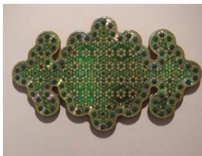
Figura 5. S/t. (Agustín Huarte, 2016).

Huarte, a la manera de un trapero, se provee de los objetos elegidos (CDs): ruinas de soportes digitales que ya no se usan para trasladar información, sino que ahora devienen su material. Crea prolijos objetos que podrían ser calificados de decorativos si no descubriéramos el dispositivo simbólico que arma para contrastar naturaleza-tecnología, identidad-tecnología y lo natural-lo artificial.