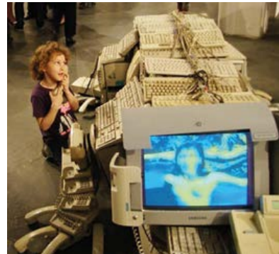
Figura 7. YA-CARE-cito. (Leonardo Gotleyb, 2010).

Aquella película que hoy relacionaríamos al kitsch , cuenta con una famosa escena de la actriz, bañándose desnuda en un lago; esa escena fue la primera que muestra un desnudo frontal en la historia del cine argentino. El montaje realizado para la obra de Gotleyb con operaciones de found footage o metraje encontrado, incorpora la forma-pantalla a una videoinstalación que además es escultórica. La pantalla es más que lo que deja ver, más que el recorte de su forma. En las videoinstalaciones, la forma-pantalla cobra el sentido de multipantalla o de pantalla en sus múltiples acepciones: por lo que muestra sobre su superficie, por lo que encubre y por lo que se proyecta o transmite simbólicamente en ella. En esta obra, los desechos tecnológicos se vinculan y componen lúdicamente, pero en forma retórica, en sentido formal; simbólicamente, para alertar además sobre una especie en peligro. En forma metafórica, los ojos-pantalla y las fauces abiertas del yacaré, encarnan una especie de deseo alimentario inverso, pero a la vez las fantasías eróticas de una época. La obra no sería posible sin ser contextualizada, porque en su dinámica relacional requiere de un guiño cómplice con el público interactor.