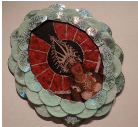
Figura 3. S/t. (Agustín Huarte, 2016).

Agustín Huarte, artista visual del interior bonaerense (Argentina), con paciencia artesanal reúne CDs: eso que sirvió y fue reemplazado como soporte y unidad de almacenamiento de información y que se empleó para su lectura, accesibilidad y transportabilidad; la ilusión tecnológica de la memoria omnisciente, requirió del diseño e invención de distinto tipo de soportes de archivo. El progreso e invención de nuevos formatos de almacenamiento lanza a su ruina a los anteriores, y también a los archivos que atesoraban. Los CDs caídos en desuso o nunca usados, vacíos, distorsionados o reformateados, vuelven su propio brillo e iridiscencia en una nueva cualidad de lo ruinoso: parecen nuevos, pero ya son obsoletos o poco funcionales. Sin perder materia, perdieron funcionalidad, agilidad y eficiencia. La obsolescencia es el nuevo síntoma causal de la ruina tecnológica; como material artístico empieza a servir para otra cosa en obras desde donde hablan de su artificialidad y efímera existencia, pero también de lo artificioso. En la obra de Huarte actúan como marco de figuras carnavalescas acompañando el centelleo de los trajes de sus bailarinas; están ahí para imitar los destellos de iluminación de las comparsas en las carnestolendas (Figura 3). Como ruina tecnológica, aporta su brillo a la representación de escenas de una fiesta popular. Aquel objeto sin identidad propia, sirve a la manifestación de lo identitario.