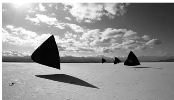
Figura 10. Aerocene Pacha. (Tomás Saraceno, 2020).

Por otra parte, los activismos artísticos que hablan de esas periferias y de las ruinas o despojos de lo que está en extinción en la naturaleza y en las culturas de cada sistema-mundo. La recreación de lo que resta o lo que ya no está en otra parte, garantizándole la aparición allí donde cause impacto masivo y visibilidad. Un arte que obliga a un exilio del propio artista para instalar la ruina facticia (artificial, pero compuesta para parecer natural) que evoca aquellos restos lejanos.