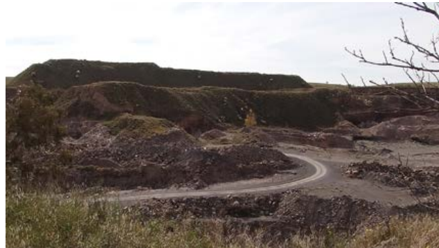
Figura 2.

Más adelante, el descontrol del consumo produce sus desechos que por su sobreabundancia son imposibles de acopiar, irreductibles, seriales y todos idénticos los de un mismo tipo; superados por otros con mejores y más complejas funciones. Esos objetos desechados no han sido programados para destruirse a sí mismos cuando ya son inútiles: sucede con los dispositivos electrónicos e informáticos que se incorporan al repertorio de ruinas portátiles, conceptualmente entendidas en su forma dilatada y amplia. Junto a los objetos físicos (dispositivos, máquinas, aparatos), las producciones de imagen y archivos que se acumulan lesionados, olvidados o destinados a nunca ser revisitados.