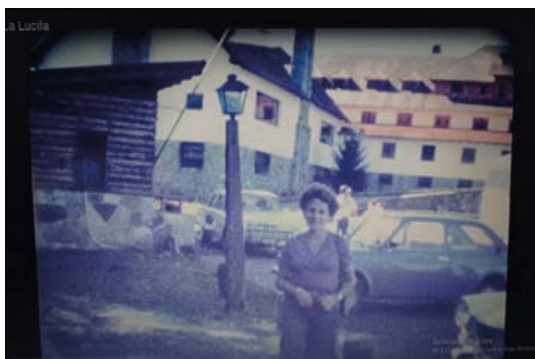
Figura 8. Fotograma del Videoclip del tema La Lucila . (Suez, 2018).

en los años '70 y '80, a ese formato de filmación. Si el registro de los acontecimientos familiares y el soporte de los recuerdos fue largamente almacenado en imágenes fotográficas analógicas durante décadas, las historias familiares entran al mundo de las imágenes en movimiento justamente a través del Súper 8, formato que fue reemplazado por otras tecnologías hacia las cuales también migraron los archivos. Las imágenes del videoclip son originariamente del ámbito familiar y privado, pero la empatía e identificación hacia esos momentos consiste en la similitud a las de un viaje de cualquier familia o pareja: el sueño de llegar a Bariloche como destino y sueño privilegiado de una época, registrando los lugares típicos de recorrido y las tomas paisajísticas tradicionales. Hablamos aquí de una forma-pantalla reminiscente y la tentativa de la búsqueda de los protagonistas originales de esas imágenes para cerrar una historia circular.