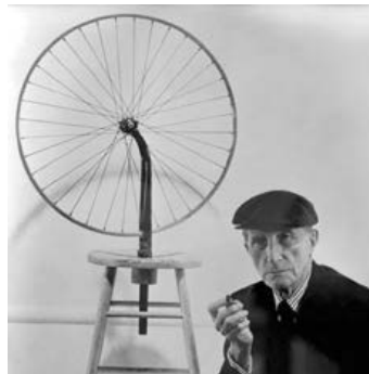
Figura 1. Rueda de bicicleta , Duchamp, 1913.

Cuando en 1913 Duchamp presentó su Rueda de bicicleta (Figura 1), en el arte se comienzan a ensayar teorizaciones acerca de dos aspectos centrales: la cuestión de los materiales y la de la institucionalidad-arte. Abordaremos particularmente la primera de esas cuestiones, en lo referente a la inclusión en obras artísticas de materiales a postproducir a partir de objetos industrial o tecnológicamente creados con una finalidad y funcionalidad inherente ajena al arte. Materiales cuyo empleo no tiene una historicidad dentro de la concepción hegemónica del arte y, por consiguiente, no tienen una tradición en el arte. Así, la carta de materiales no sólo se amplió sino que se hizo infinita y también el repertorio de sus ruinas.