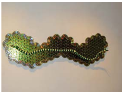
Figura 4. S/t. (Agustín Huarte, 2016).

Esa narrativa excede al autor, ya que es el interactivo quien en presencia de la obra activa el dispositivo creado, y hace que ese material mudo empiece a hablar desde sí. Una serpiente (Figura 4) ondula sobre un soporte verdoso que simula lo natural, pero es un patrón rítmicamente construido en una trama regular de CDs esclavizados a su nueva forma. La naturaleza se filtra en los vestigios tecnológicos y sin utilizar digitalmente un soporte que en sí es digital, vincula en forma retórica la figura de la víbora con la de esos objetos tecnológicos muertos. Formas arborescentes (Figura 5), agrupamientos florales, combinaciones matéricas con pedrería decorativa. Artificios para imitar a la naturaleza con objetos cuyo uso y desecho de todas formas daña a la tierra. Al menos en esos objetos, la naturaleza encuentra una revancha metafórica con diseños y tramas geométricos y de formas plenamente orgánicas con objetos inorgánicos. Objetos inertes que se reactualizan y resignifican en una narrativa de lo vivo.