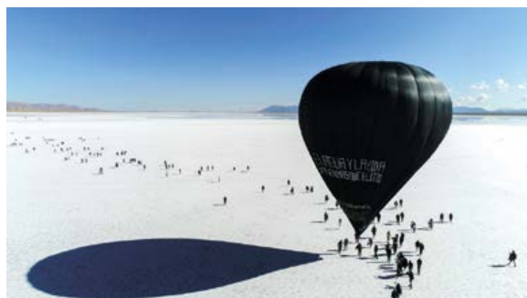
Figura 9. Vuela con Aerocene Pacha. (Tomás Saraceno, 2020).