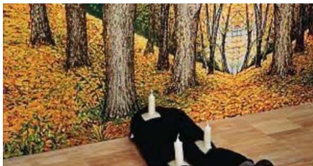
Figura 5. El corazón no es una metáfora , de Robert Gober (1989).

hace ver, lo que entra en relación con la necesidad de descentrar no solo nuestra mirada sino también a nosotros mismos; de “provincializar Europa” (Chakavarty, 2000) e incluso de barbarizarla (Galcerán, 2016); de comprender que no existe ya tan solo una única narración desde Occidente, en comprender cómo se inserta los valores del colono con los del colonizado (Bhabha, 2007).