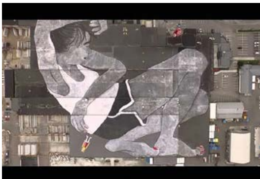
Figura 3. Lilith and Olaf , (Ella & Pitr., 2016)

de un ir más allá, de producir esa transfronterización del pensamiento de la que venimos hablando. Y es por ello que escogemos dos obras recientes que de una manera u otra tienen que ver con la práctica de viaje y con la imaginación. En primer lugar (Figura 3) observamos la imagen de una niña que juega distraídamente con un muñeco de un Rey.