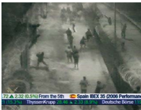
Figura 1. Wals , de Rogelio López Cuenca (2006)

En el año 2006, uno de los de mayor llegada de inmigrantes irregulares a España en los últimos años, el artista Rogelio López Cuenca propone la videoinstalación Wals , en donde sitúa unos videos en los que se puede percibir migrantes intentando saltar la valla de Melilla a la vez que en la parte de debajo de la pantalla se ven cotizaciones de la bolsa de esa misma jornada. Automáticamente, nos viene a la cabeza la relación entre una colonialidad del ser (el sujeto migrante sometido a una denostación de su capacidad como ciudadano libre y cosmopolita, en conflicto con un muro que lo expulsa; unido a una imagen que recuerda a cierto encarcelamiento por estar configurada en torno a dos muros que actúan a modo de verjas carcelarias); una colonialidad del poder (en la que el cuerpo del estado magnificado en esos muros soberanos se antepone y erige su altura frente a los minúsculos cuerpos de los migrantes); y una colonialidad del saber (que implica no solamente un saber técnico que nos habla de una arquitectura constructora, a modo de demiurgo, de la soberanía estatal sino que además expone toda una serie de datos, logaritmos, correlaciones económicas y capitales financieros de los cuales se intuye que el migrante podría ser una cifra más pero que no se sabe realmente cómo insertarlo en la ecuación). Y por supuesto aparece aquí un pensamiento fronterizo, un ir más allá, un utópico derribe de muros en donde lo humano se coloque sobre lo económico (personas arriba, datos abajo).