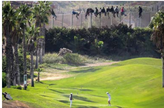
Figura 2. Migrantes saltando la valla, de José Palazón (2015)

Observemos que el autor ha sabido captar esa ausencia precisamente en el momento oportuno en que los golfistas en primer término continúan absortos en el juego y dando la espalda a una realidad que sobrecoge al espectador pero que en ellos es indiferencia.