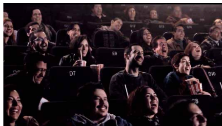
Figura 3. Flora e Igor en el cine

La escena en que Igor está en el cine con Flora, después de su primer encuentro con Pina, muestra este uso dinámico del lenguaje cinematográfico para comunicar las emociones de los personajes, pues comienza con un plano general de Pina e Igor y mediante un dolly in termina en un primer plano sobre este último, exponiendo la crisis que significa para Igor su encuentro con Pina (Figuras 3, 4).