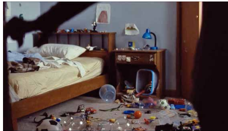
Figura 5. Pina encuentra el desorden de Lorenzo

La fuerza dramática más poderosa que muestra estas relaciones desgastadas se construye a partir de dos secuencias paralelas que revelan el rechazo y hartazgo de Pina e Igor. Después de haber discutido con Lorenzo sobre lo desordenado que es, mientras está en la escuela, Pina decide tirar todos sus juguetes a la basura, en un acto que refleja su frustración y la necesidad de librarse de él para rehacer su vida. Aquí la alienación compartida con Lorenzo se logra a través de los primeros planos a los rostros de los personajes y al diálogo en voz en off que acompaña la secuencia, pues mientras Pina se deshace de sus juguetes, Lorenzo es incapaz de recordar la poesía que debe recitar para el festival, justo la frase “Qué las cadenas nunca más regresarán” (Figuras 5-10).