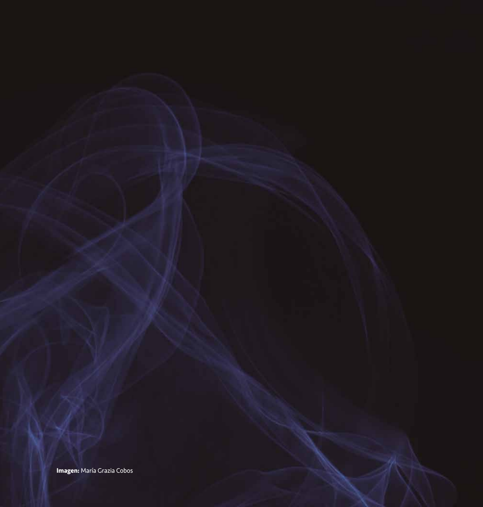
Imagen: María Grazia Cobos