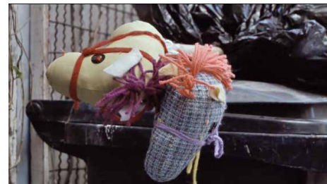
Figura 10. Todos los juguetes de Lorenzo