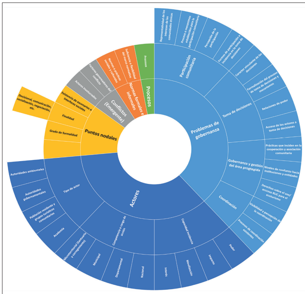
Figura 1. Categorías de análisis

Se estableció un marco analítico apriorístico a partir de la operacionalización y adaptación del Modelo Analítico de Gobernanza (MAG) de Hufty (2009, 1), definida por el autor como “una metodología pragmática que tiene como objetivo demostrar el potencial del concepto de gobernanza con respecto del análisis de problemas colectivos”. El marco propone cinco dimensiones: 1) el problema de gobernanza (lo que está en juego); 2) los actores individuales o colectivos, 3) las normas o acuerdos sociales; 4) los puntos nodales, que se refieren a espacios físicos o virtuales en donde convergen interacciones, problemas, procesos, actores y normas; y 5) los procesos, entendidos como las sucesiones de estados por los cuales pasan las otras dimensiones. También se incorporaron los conflictos en calidad de categoría emergente, por la recurrencia y relevancia revelada en la fase de análisis