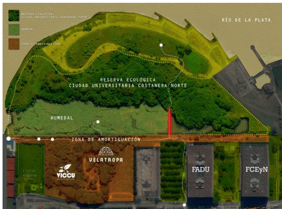
Mapa 2. Ecoaldea Velatropa como zona de amortiguación de la Reserva Ecológica Costanera Norte