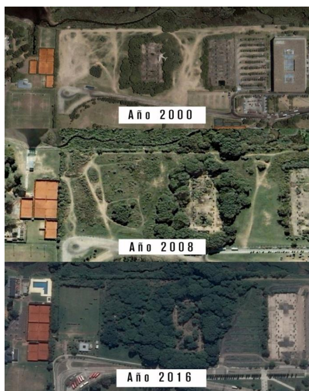
Mapa 1. Progreso de la restauración ecológica en el territorio de la ecoaldea Velatropa.