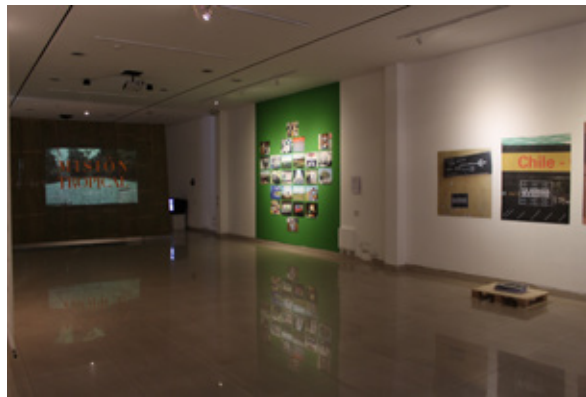
Figura 7. Vista parcial de Irreverencias. Crear en medio del abuso en Estrategias sublevantes...

se planteó como una aproximación narrada desde dos experiencias complejas y llenas de belleza en múltiples sentidos, en su esfuerzo por restaurar la energía creadora de dos comunidades azotadas por el poder dominante. Por un lado, desde el bordado ( Mujeres Bordando ), por el otro desde las artes escénicas, con el Colectivo Yama ( Memorias de Agua ). En uno, desde las mujeres que han migrado del campo a la ciudad, las mujeres del mercado de San Roque, en Quito, quedando despojadas a la fuerza de sus rutinas cotidianas y modos de relacionamiento; y, en otro, desde la comunidad campesina de Masín en el Alto Perú, golpeada y desarticulada en sus principios de autonomía por la violencia de la guerrilla y del Estado en los años 80 del siglo XX. Pero, en ambos casos, revitalizadas en lo pequeño desde la activación de su reflejo en el bordado como espacio pedagógico en doble vía, la economía feminista y la acción teatral, devenida festival anual como devolución al pueblo del que partió la propuesta.