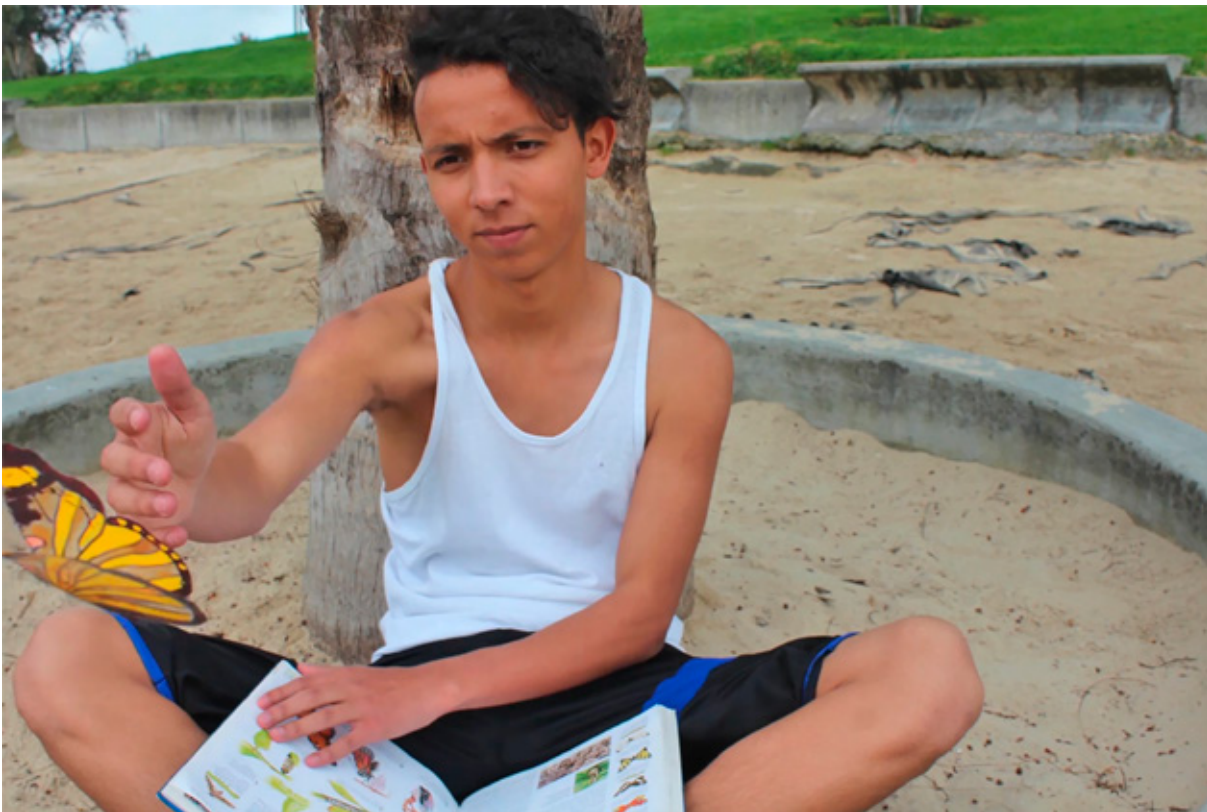
Figura 4. Alvarado, L., Quiroga, M., Beltrán, D., Jurado, A., Morales, A., Carranza, C., Vera, I., Giraldo, J., Moreno, B., Fetecua, A. (2019), Contra viento y marea. [Fotografía]. Recuperado de Roundme.com/@creatividadesamateurs