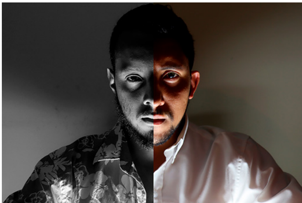
Figura 2. Quintero, F., Acosta, K., Forero, D., Neisa, C., Cortés, K., Fajardo, N., Suárez, M. y Zapata, S. (2019), Diario de un escape [Fotografía 360°].

de la narrativa una crítica en diferentes niveles ante los flagelos que sufren las mujeres migrantes en el mundo.