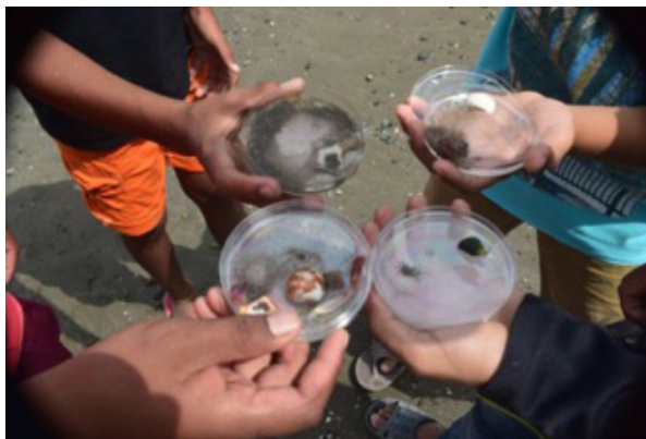
Figura 10 y11. Archivos de Laboratorio Disonancia. Taller “Biocinema” Tochigüe - Esmeraldas, 2017. Recuperadas de : www.laboratoriodisonancia.jimdo.com