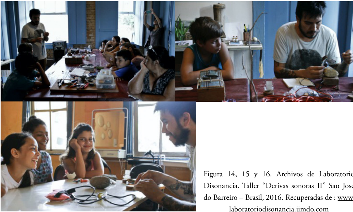
Figura 14, 15 y 16. Archivos de Laboratorio Disonancia. Taller “Derivas sonoras II” Sao Jose do Barreiro – Brasil, 2016. Recuperadas de : www.laboratoriodisonancia.jimdo.com

nuestras propuestas pedagógicas como una red de aprendizaje que, en sus actividades, actúan como un programa que necesita de la aportación asociativa de personas.