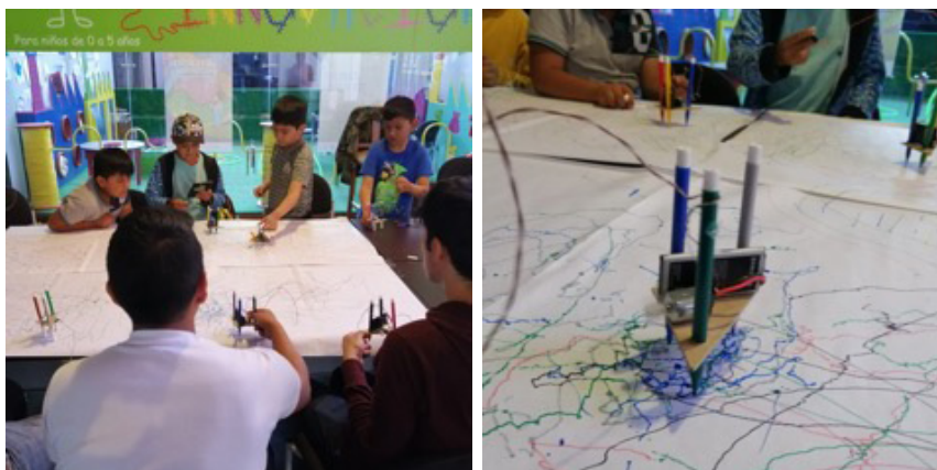
Figura 3 y 4. Archivos de Laboratorio Disonancia Taller “Dibujabot, mi primer robot” dictado en Centro Cultural Fabrica Imbabura - Cotacachi, 2011.

prácticas. Hemos sido participes de cómo los aprendices aumentan el dominio en torno a tareas adecuadas, generando una manera “otra” de comprender y explorar, conceptos desde el análisis crítico.