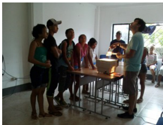
Figura 8 y 9. Archivos de Laboratorio Disonancia. Taller “Cine hecho a mano” Tochigüe - Esmeraldas, 2016. Recuperadas de : www.laboratoriodisonancia.jimdo.com

En este sentido las soluciones tecnológicas con impacto artístico—lúdico y de comunicación, pueden ser alcanzadas con materiales re-aprovechables, en asociación con mucha creatividad y predisposición a la colaboración en aulas o laboratorios de experiencias vivenciales (fig. 8 y 9). Los dispositivos caseros, por su parte, son formas creativas de encontrar soluciones a desafíos en nuestro cotidiano, en ciertas ocasiones por necesidad y, en otras, por pura inventiva; incidiendo en el entorno de los