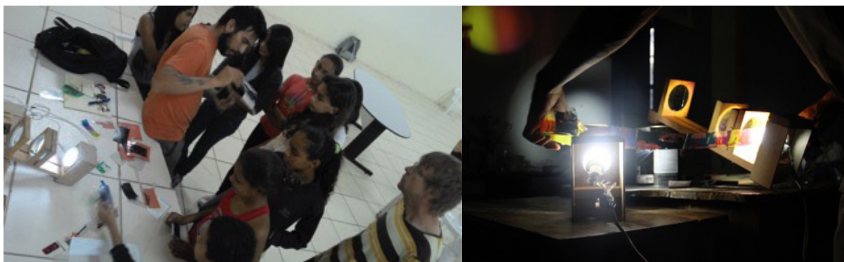
Figura 17 y 18. Taller “Cine-maNOS” Sao Jose do Barreiro – Brasil, 2014.