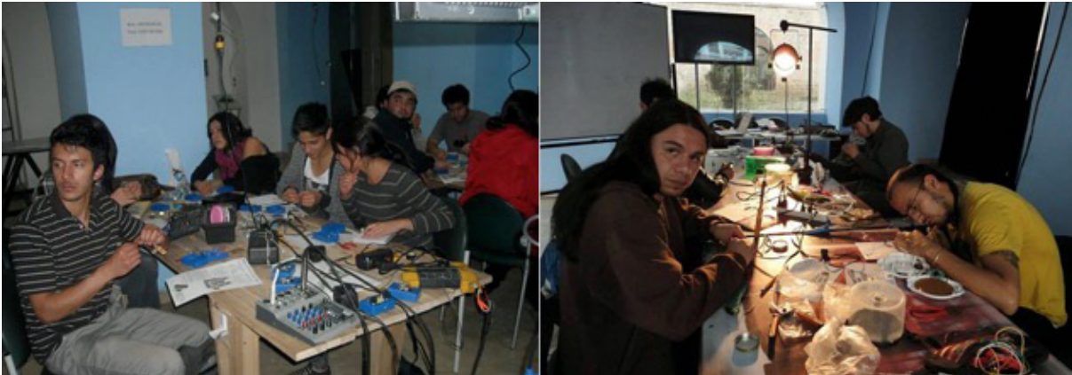
Figura 1 y 2. Archivos de Laboratorio Disonancia Taller “Circuito Intervenido” dictado en el Centro de Arte Contemporáneo - Quito, 2011.