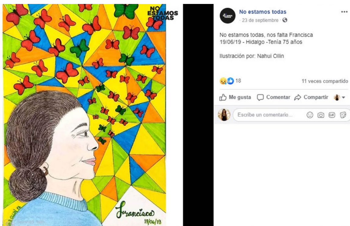
Figura 3. Movimiento #IlustradoresConAyotzinapa. Fuente: https://ilustradoresconayotzinapa.tumblr.com

días que esas personas faltan. La imagen como acto de creación y resistencia (Deleuze, 1987).