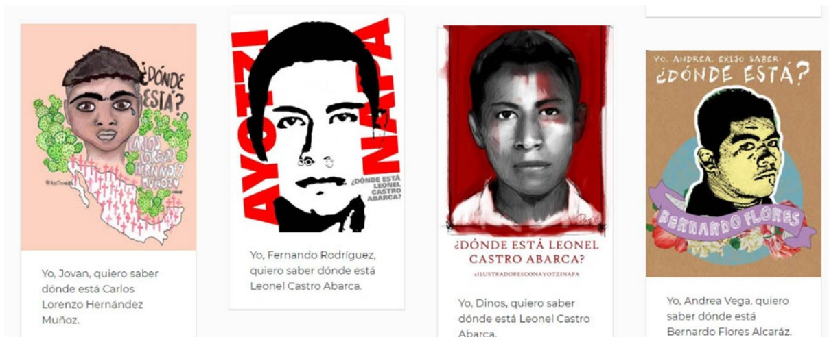
Figura 3. Movimiento #IlustradoresConAyotzinapa.