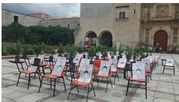
Figura 2. Manifestación por la exigencia de aparición con vida de los normalistas. Templo de Santo Domingo de Guzmán, Oaxaca, México, 26 de septiembre de 2017.

de alguna manera a los estudiantes que están allí, no en una clase, sino manifestándose públicamente. El relato visual se enriqueció cuando, en numerosas ocasiones, sobre la silla o la mesa del pupitre se añadía una vela, o la fotografía del rostro, como en Oaxaca, cuando a tres años de los hechos, profesores, normalistas y activistas de organizaciones no gubernamentales, se pronunciaron frente al templo de Santo Domingo de Guzmán (Figura 2). Esta acción se replicó también dentro de escuelas y universidades. Y en casos especiales, como el 13 de julio del 2018, en el acto de graduación de la generación 2014-2018 de la Normal de Ayotzinapa, generación a la que le faltan los desaparecidos y asesinados de la noche de Iguala 9 .