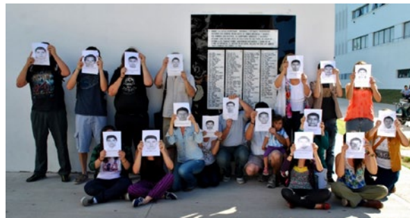
Figura 3. Fotografía de estudiantes de la Facultad de Humanidades y Ciencias de la Educación, Universidad Nacional de La Plata, frente a la placa de detenidos desaparecidos de la última dictadura cívico militar. Jornada en

Otra acción destacada fue el uso de las fotografías de los rostros de los normalistas. En el mes de noviembre, en el patio central de la FaHCE, los estudiantes se organizaron para tomar unas fotografías que luego serían difundidas por redes sociales y medios de comunicación mexicanos. La consigna fue colocarse frente a la placa que recuerda a los detenidos y desaparecidos de esta facultad durante la última dictadura cívico militar (1976-1983), cubriéndose el rostro con la copia en blanco y negro de la fotografía de un normalista (Figura 3). Esto permitió trazar un puente entre el pasado de Argentina y la práctica de la desaparición forzada de personas, con el presente mexicano (Jean Jean, 2015).