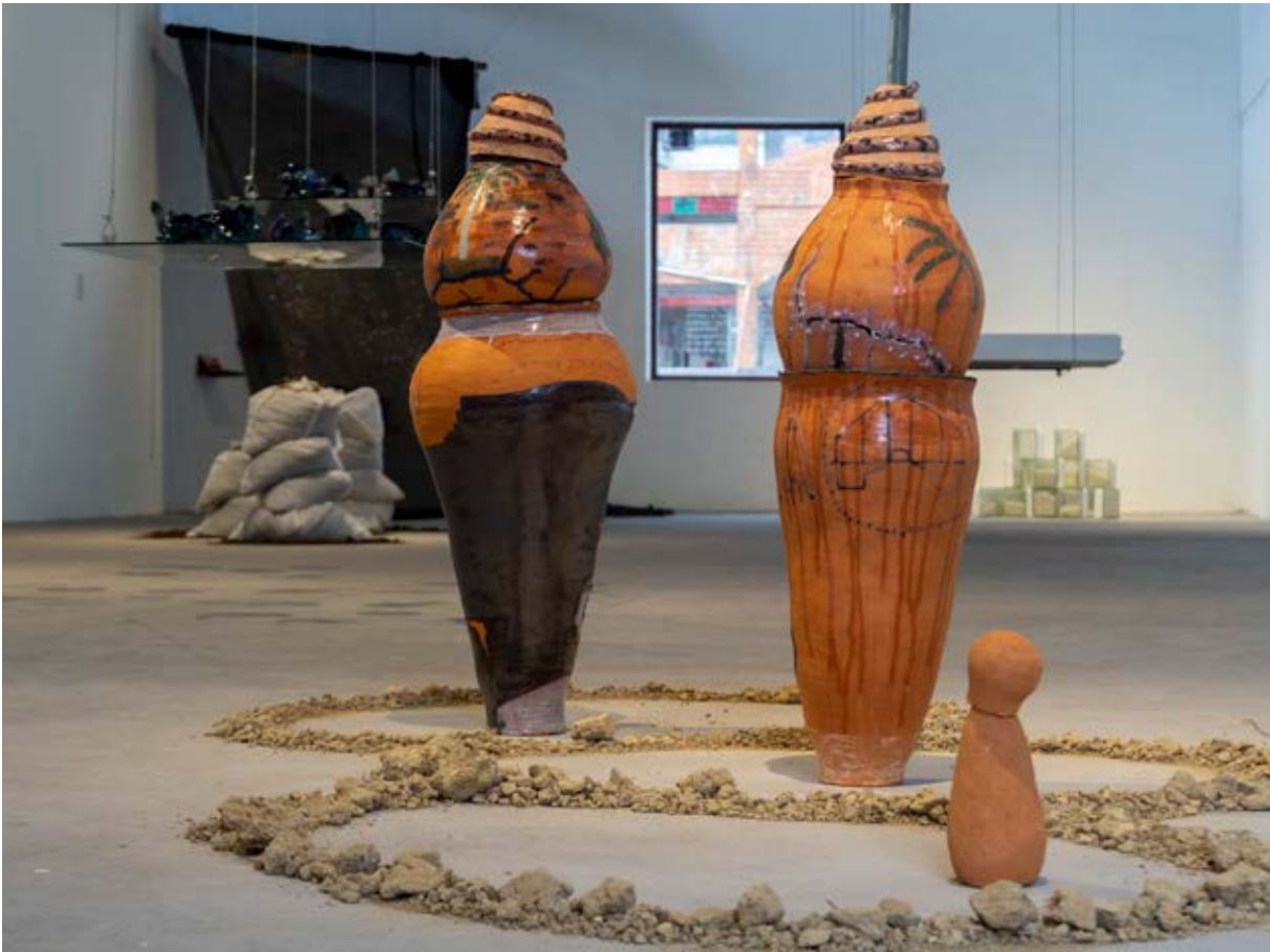
Figura 16. La Cura , 2019. Fotografía de Nicolás Saavedra, 2019.