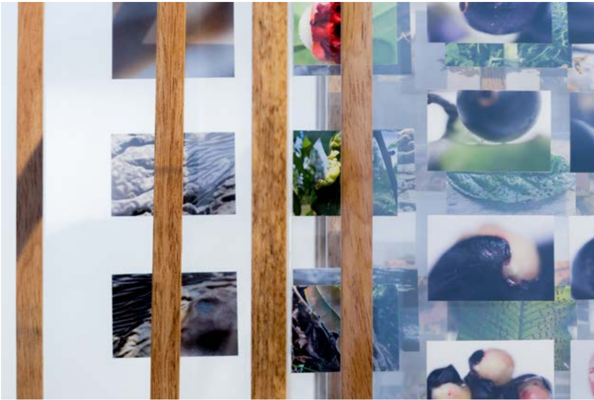
Figura.9. Herbario parásito , 2019.

poco temerarios y monstruosos, lo cual las convierte, para la percepción científica, en un ecosistema invasor para la comunidad vegetal. Desde este lugar, el carácter parasitario ha quedado como una rama de la botánica, estudiada desde la Teratología, cuyo nombre proviene de dos palabras griegas: “ Teratos , un presagio temeroso enviado por los dioses y, por lo tanto, un ser monstruoso. Logos un discurso o tratado. Las dos palabras en conjunto; el tratado de los monstruos ” (Plantefol, 2014, p. 1).