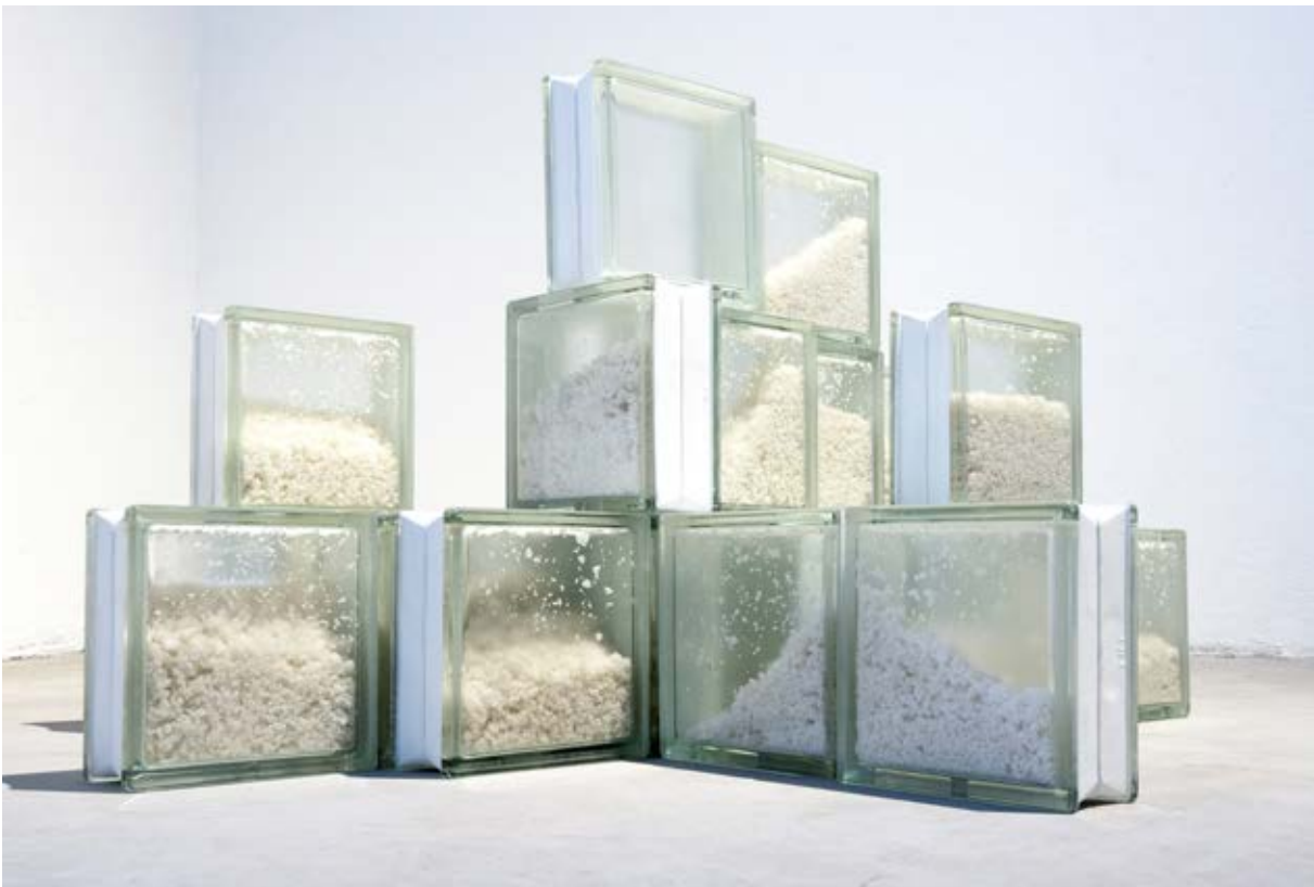
Figura 3. Población Flotante , 2019. Fotografía de Nicolás Saavedra, 2019.