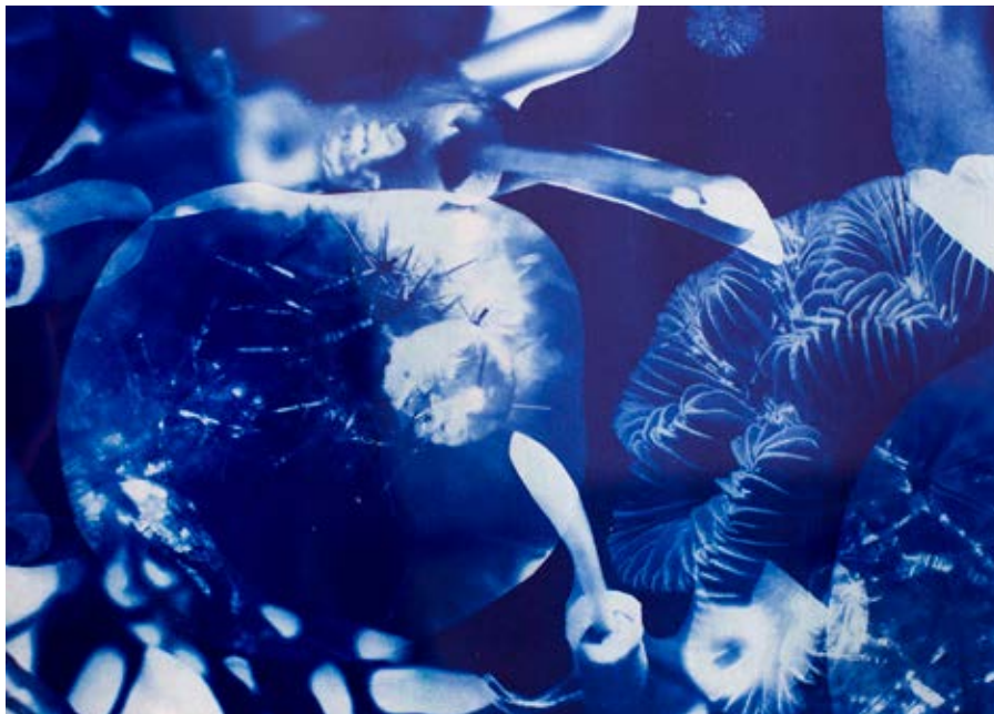
Fig. 7. Teratos , 2019.