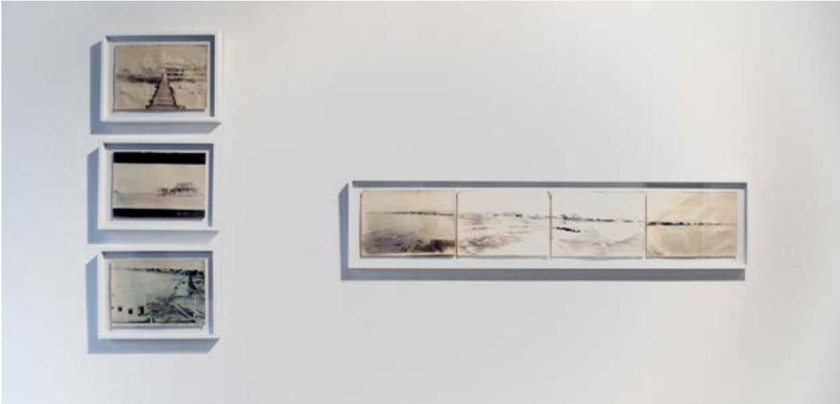
Figura 2. Contrapalmón , Fotografía de Nicolás Saavedra, 2019.