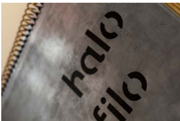
Figura 4. Halófilo , 2019.

Halófilo de 2019 es interpretado, desde la recursividad del formato libro como objeto y no como libro per se. Es un objeto de dos frentes, por un lado, la reinterpretación a dos tintas en risografía de los archivos de Contrapulmón , y, en otro eje, con apuntes visuales de los trabajos de campo. Es un ensayo contenido entre dos planchas de aluminio lijado, tallado láser y anillo de cobre. Son páginas que sugieren ser intervenidas. Páginas que podrían ser los bocetos de una investigación paralela. Los “halófilos” que nombra Ana son organismos con la capacidad de resistir concentraciones extremas de sal. La existencia de nuestra especie en relación a la de los organismos halófilos son esa configuración propia de un estado de inmersión, de esas concentraciones extremas de riesgo o desequilibrio contemporáneo. Estas páginas son un escombros, son pausas y acciones en un intento por crear sistemas de referencia, que se extingan y recreen los modos puntuales de reconocer las historias que nos componen, sin asumirlas con una identidad fija.