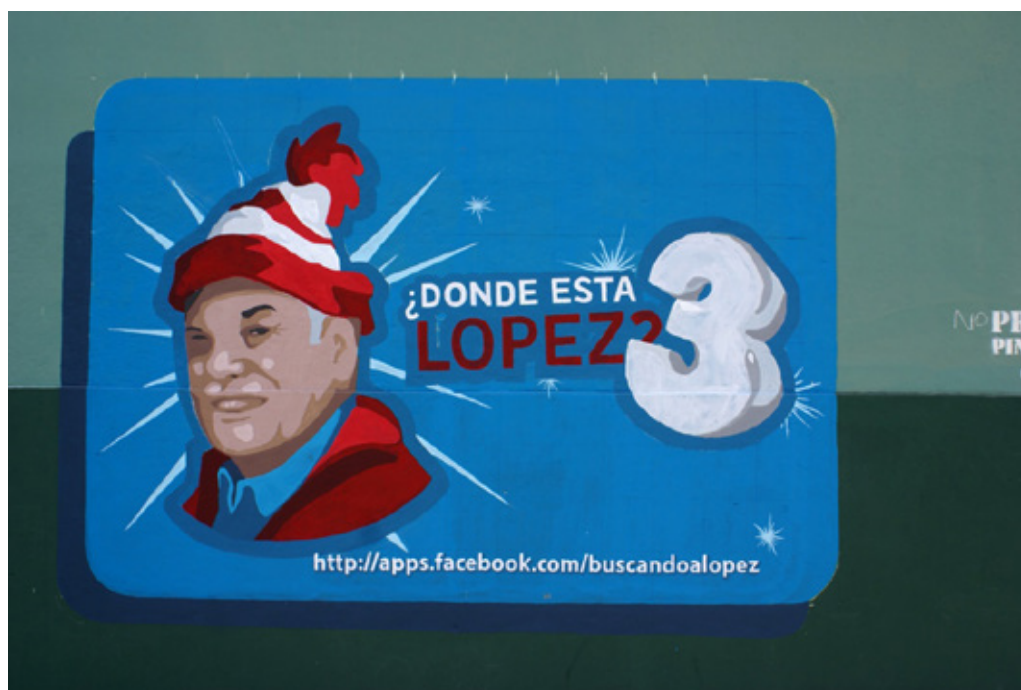
Figura 1. Mural en el espacio público. Diagonal 73 esquina 4, La Plata, 2011.

Analizaremos, a continuación un ejemplo que nos muestra una práctica artística que no sólo se llevó a cabo en el espacio público sino que también se replicó a través de redes sociales o el espacio de la web. Se inscribe dentro del denominado arte de acción (Alonso, 2011) y se centra en el “juego” como recurso. Se entiende por arte de acción a las tendencias del arte que consisten en acciones del artista, ya sea con objetos, con su propio cuerpo o con otros participantes. Este tipo de producciones, que además irrumpen en el espacio real y virtual, apelan de manera insistente al entorno humano, quien se transforma en espectador, usuario y/o partícipe. A su vez, una acción como “juego”, es una obra participativa y abierta donde el espectador asume también una posición distinta a la del pasivo espectador tradicional, y propicia una actitud más participativa.