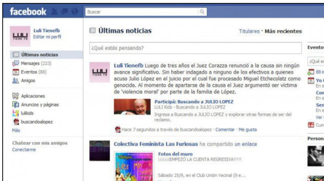
Figura 2. Captura de pantalla con información sobre la causa judicial. Facebook del colectivo LULI

donde se buscaba a López como si fuera Wally, y cada uno de los posibles escondites se relacionaba con la causa judicial que se llevó a cabo contra el represor Etchecolatz. Para ingresar al juego, como dijimos, se accedía a través de su página en Facebook . En el blog de LULI se explicaba además cómo surgía la idea de la realización de Buscando a López , la cual tuvo tres ediciones entre 2010 y 2011. Tal como sostiene Perez Balbi (2012), la primera edición del juego aludió a la causa y al reclamo por la desaparición de Julio López y en la segunda edición se hizo referencia a la militancia de Julio López en la década de los setenta. Esta acción, que comenzó en el 2010, se continuó entonces al cumplirse un año más de la desaparición y en ese caso nuevamente se resaltaba el recurso del juego como aporte al reclamo, incorporando, además de la de López, otras desapariciones en democracia.