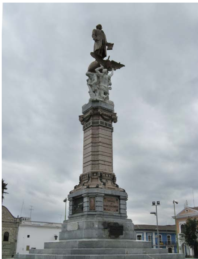
8. Monumento a Pedro Vicente Maldonado. Riobamba.

cargadas. Esto originó un juicio por parte del Municipio de Riobamba en contra de Francisco Durini, quien con sus abogados intentó evitar la multa y la cárcel, para lo cual solicitó una prórroga del plazo del contrato. Un fragmento de la defensa está suscrita por Juan Antonio Vela y recogida del archivo municipal por Franklin Cepeda: