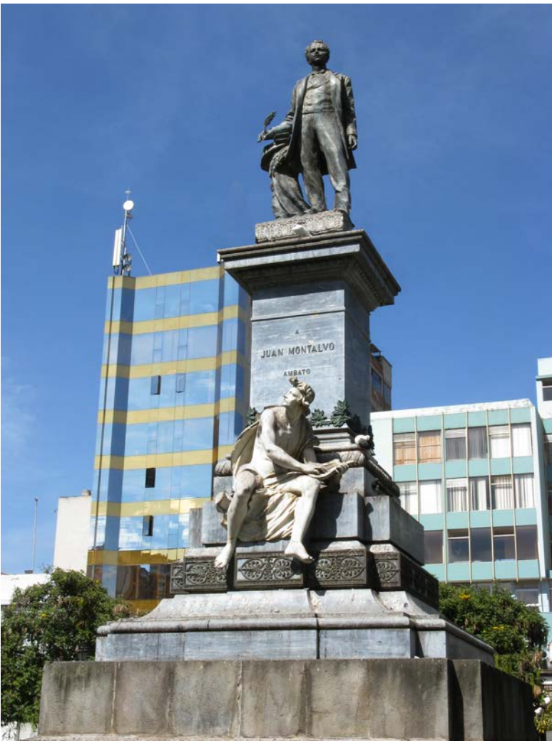
5. Monumento a Juan Montalvo. Ambato.

su preocupación por la ejecución de las piezas del monumento, tiempos, costos, y la entrega oportuna del boceto escultórico para la toma de decisiones por parte de la Junta: