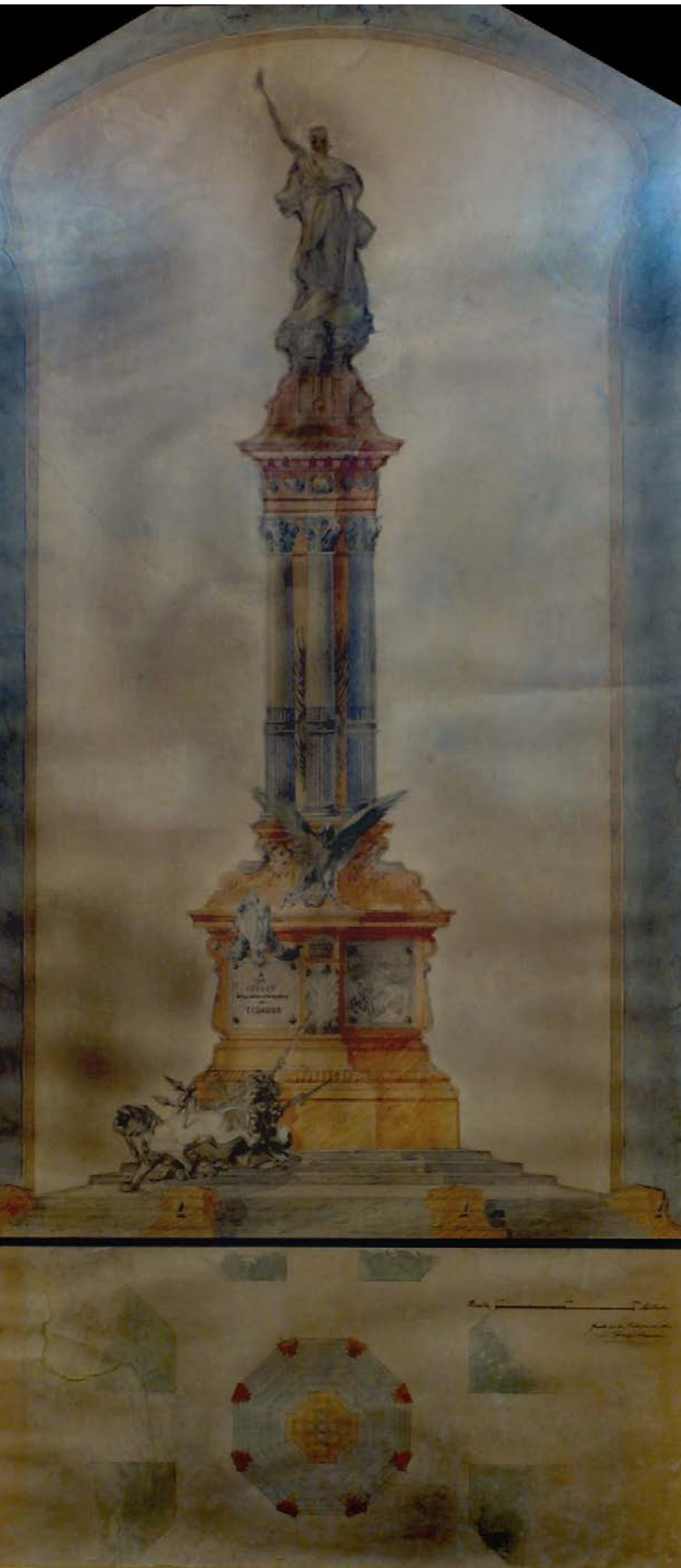
10. Acuarela del monumento a la Independencia de Quito. L. Durini. Acuarela sobre cartulina. Dimensiones: 0,65 x 1,31 m.

de la ciudad, está situada frente a la catedral y los principales edificios públicos del país. El diseño del monumento, el parque que lo rodea y la colocación de rejas con 8 puertas, fuentes, bancas y luminarias pusieron en evidencia el cambio de imagen que requería Quito, como capital de la República del Ecuador, que se disponía a celebrar el centenario de su independencia (Ver Figura 11).