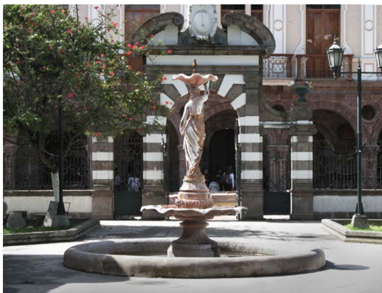
6. Fuente y cerramiento del parque de Ambato.

sin embargo, en la práctica las fuentes fueron elaboradas por la fábrica Fonderies d'art du Val d'Osne, cuya dirección en París era 58 Bd. Voltaire (trabajo de campo).