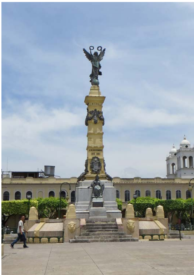
2. Monumento a la libertad en la plaza mayor de San Salvador. 1811. Monumento en mármol y bronce. Altura: 20 m