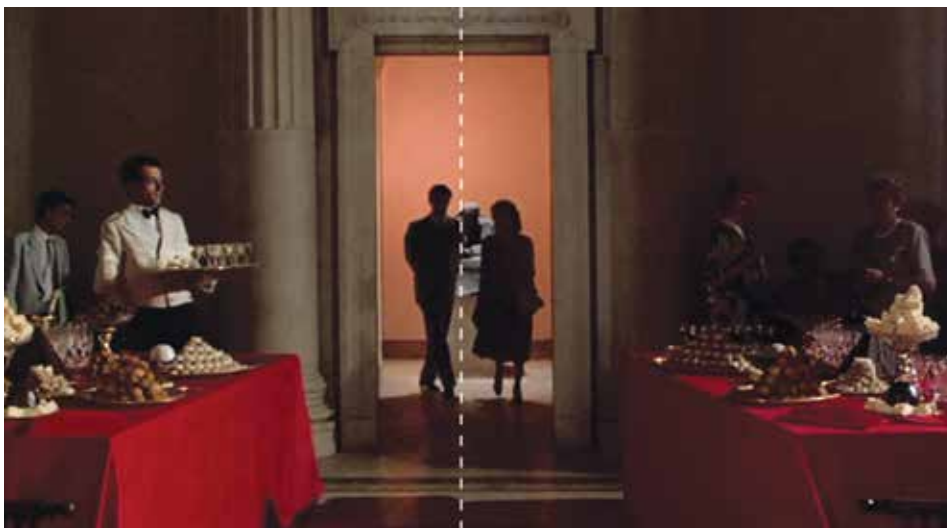
Figura 8: minuto 16:09