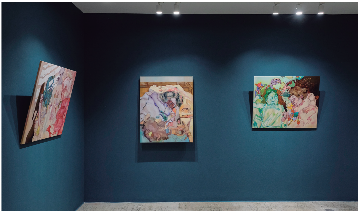
Figura 2. Vista de la exposición. 2023.