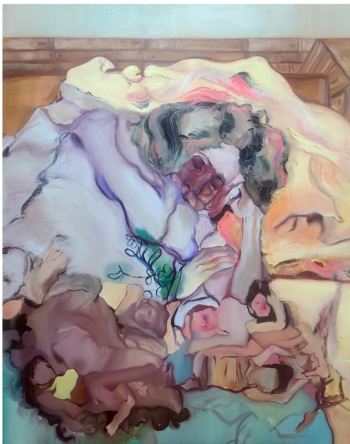
Figura 21. Maureen Gubia. "Hipnocolcha". Óleo sobre lienzo. 100 x 80 cm. 2022 – 2023.