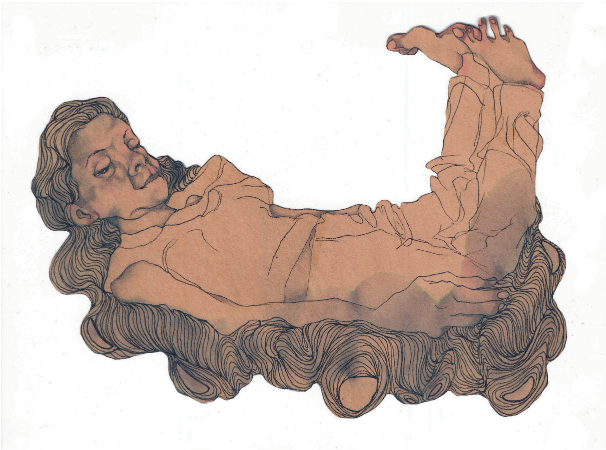
Figura 16. Maureen Gubia. "Levitas". Tinta y grafito sobre papel. 14.4 x 19.5 cm. 2005.