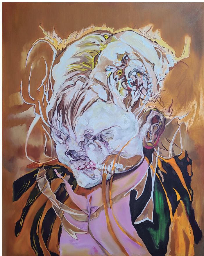
Figura 8. Maureen Gubia. “Deus Ex Hausta”. Óleo sobre lienzo. 150 x 120 cm. 2023.