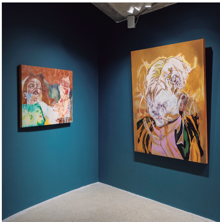
Figura 18. Vista de la exposición. 2023.