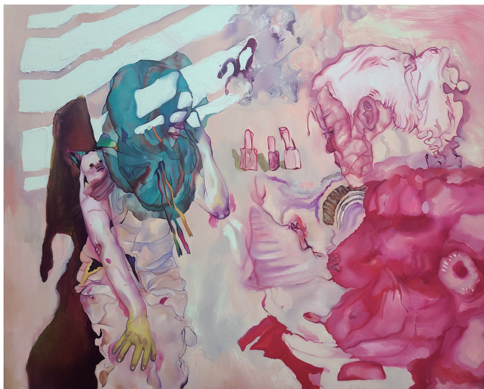
Figura 9. Maureen Gubia. “Internetia Reflux”. Óleo sobre lienzo. 80 x 100 cm. 2022 – 2023.