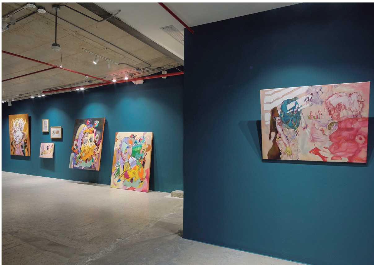
Figura 1. Vista de la exposición. 2023.