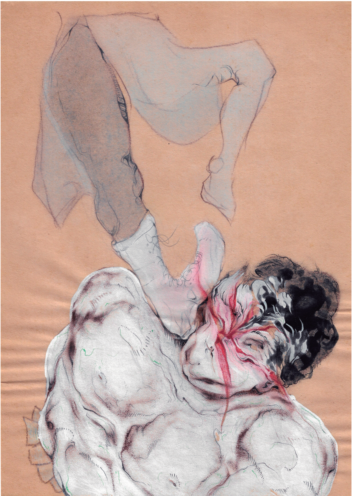
Figura 7. Maureen Gubia. "Taconazo Pony Strut". Tiza pastel, grafito y t mpera sobre papel. 29.7 x 21 cm. 2007.