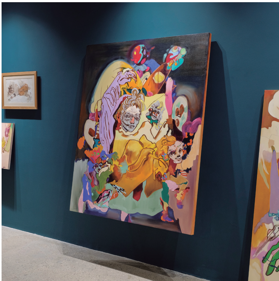
Figura 11. Vista de la exposición. 2023.