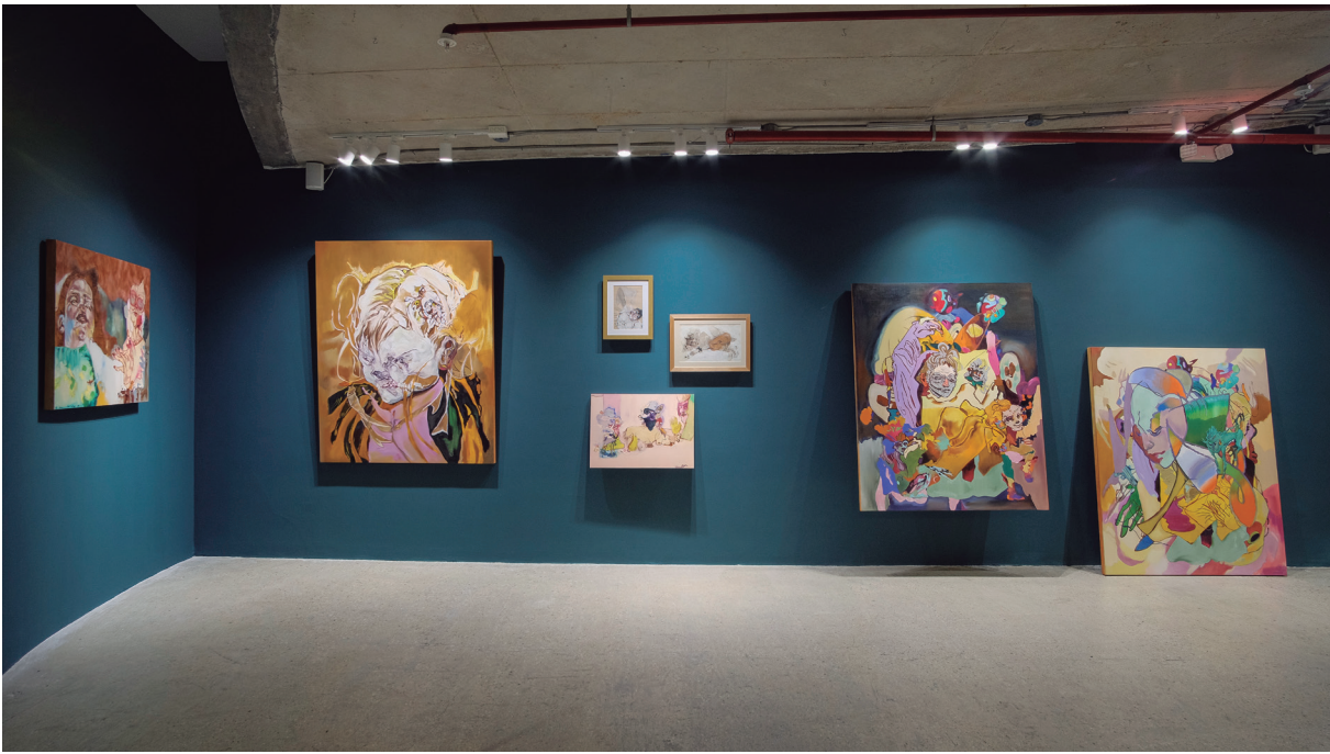
Figura 10. Vista de la exposición. Fotografía cortesía de la galería Proyecto N.A.S.A.(L). 2023.