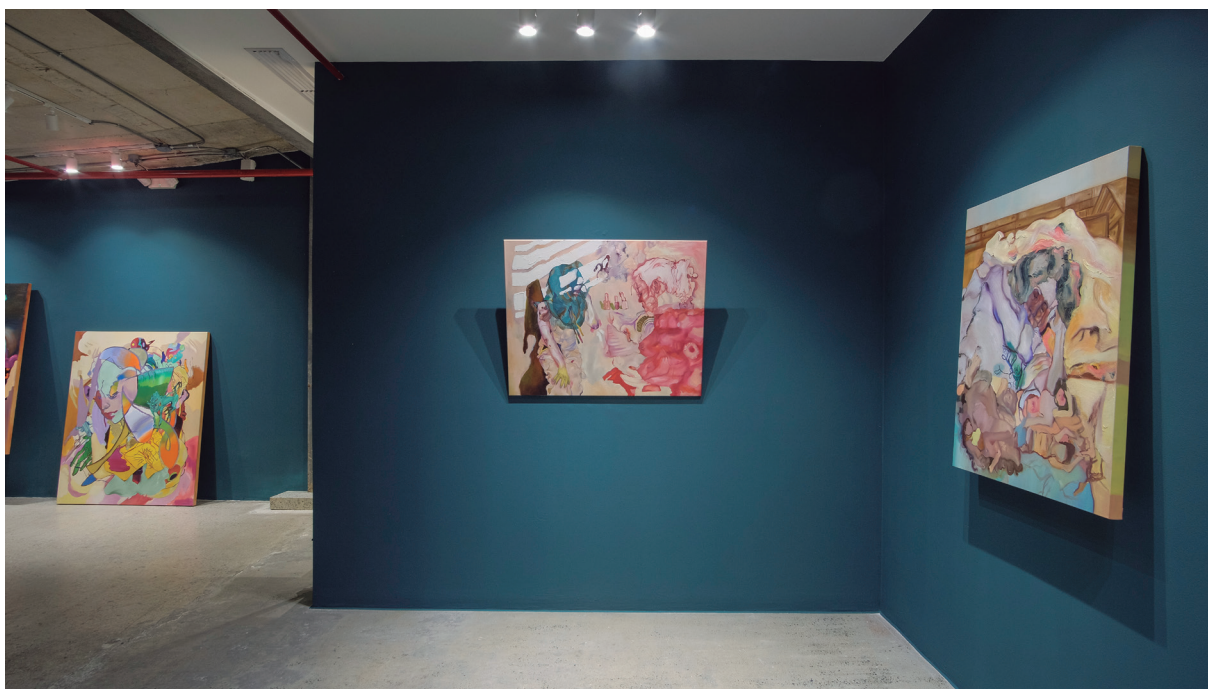
Figura 22. Vista de la exposición. 2023.