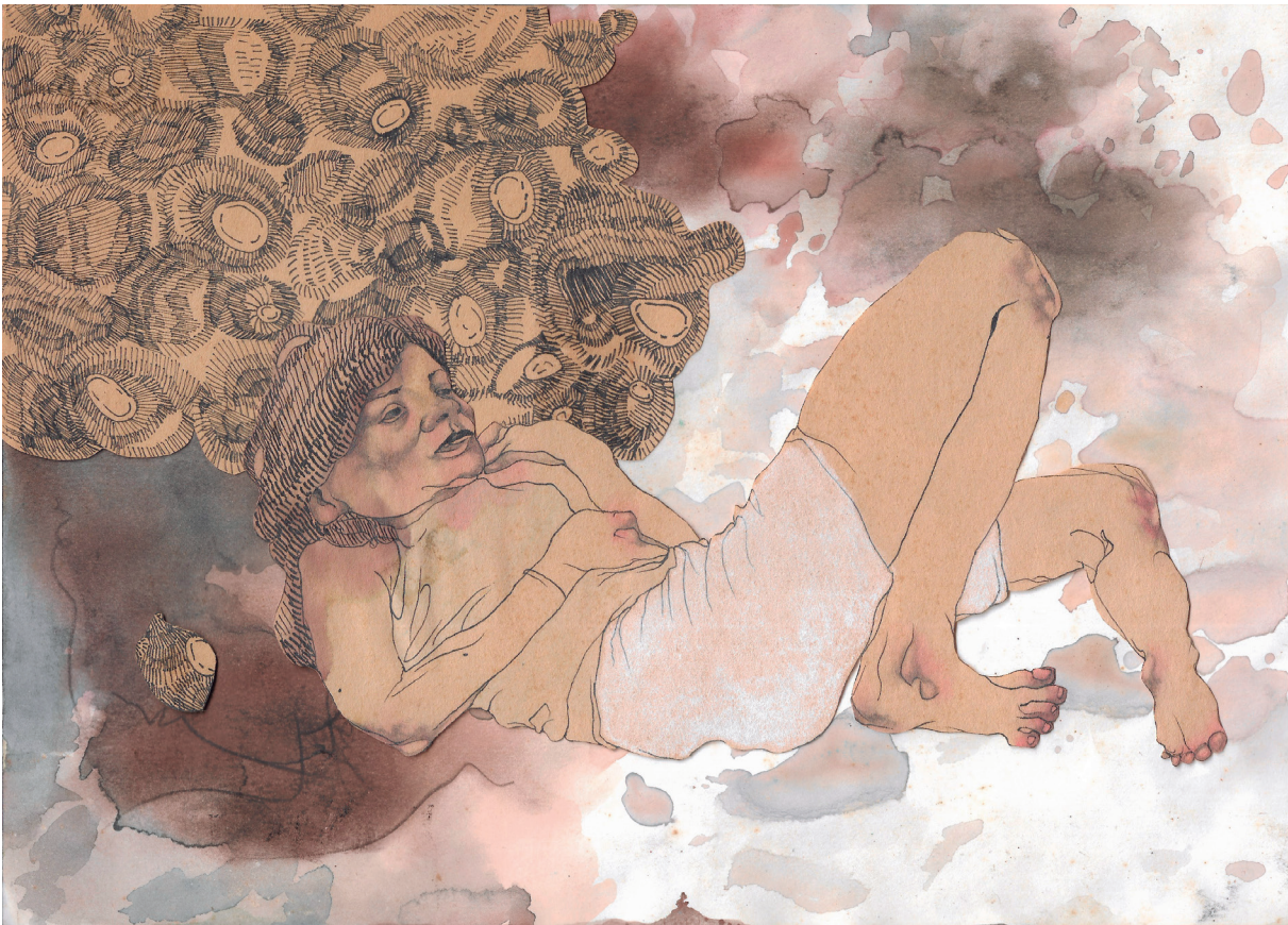
Figura 13. Maureen Gubia. "Mafer crustácea". Tinta, grafito, acuarela y tiza pastel sobre papel. 21 x 29.5 cm. 2005.