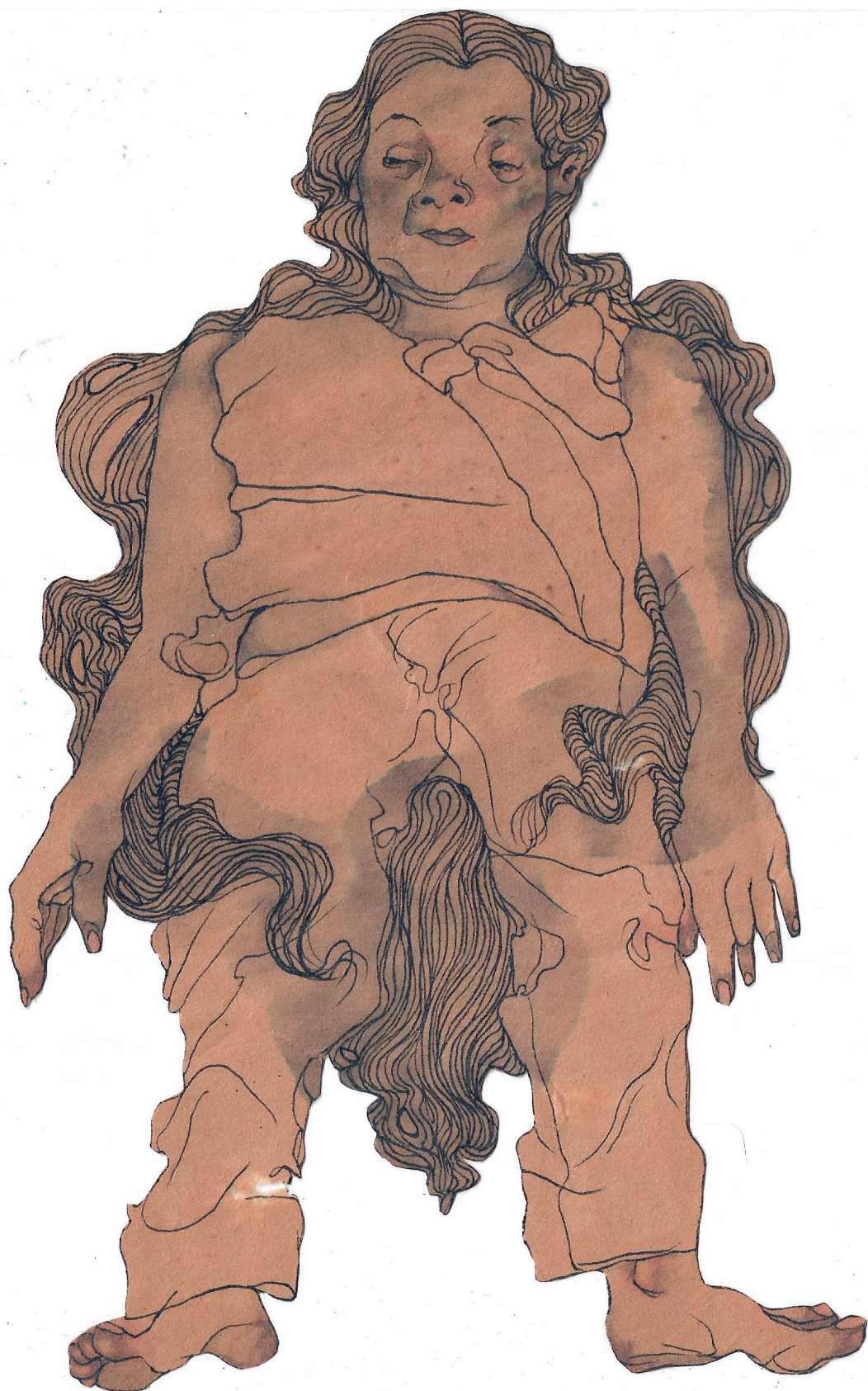
Figura 15. Maureen Gubia. "Levita". Tinta y grafito sobre papel. 20.3 x 13 cm. 2005.