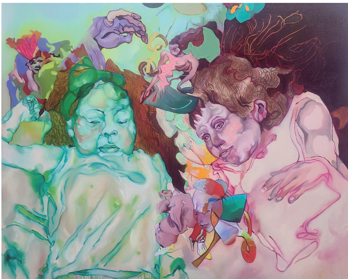
Figura 6. Maureen Gubia. "Flora y Fauna". Óleo sobre lienzo. 80 x 100 cm. 2022 – 2023.