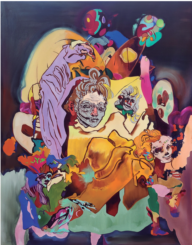
Figura 17. Maureen Gubia. "Aleatoria006". Óleo sobre lienzo. 150 x 120 cm. 2023.