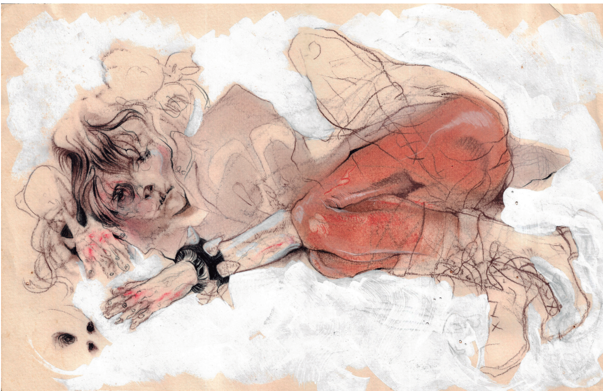
Figura 14. Maureen Gubia. "Cranium paterno". Tiza pastel y t mpera sobre papel. 26.3 x 41.5 cm. 2007.