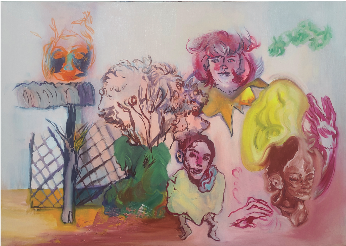
Figura 3. Maureen Gubia. "Videollamada Urdesa". Óleo sobre lienzo. 49.5 x 69.5 cm. 2022 – 2023.