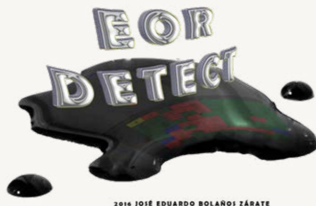
Ilustración 1 Pantalla de Inicio EOR DETECT

A través de la sistematización de los parámetros establecidos durante el proceso de recopilación, análisis y definición de criterios se culminó el proceso de creación del código fuente y compilación del programa, cuyo icono y pantalla de inicio nos muestra la Ilustración 1.