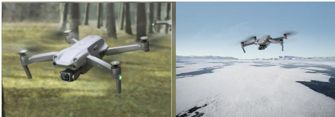
FIGURA 1 Vuelo de drones