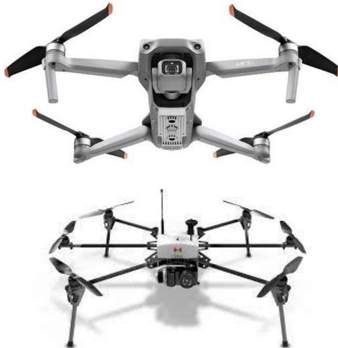
FIGURA 3 Drones de Ala rotatoria