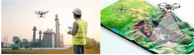
FIGURA 5 Usos drones

La Organización de Aviación Civil Internacional (OACI), o ICAO en su versión inglesa, ha desarrollado un Plan Mundial de Navegación Aérea hasta el 2030. A partir de este ambicioso proyecto, las entidades que regulan la aviación civil que hacen parte de los países vinculados, se encuentran comprometidos con cumplir estas metas, incluidas la de integrar el uso de Drones o UAS al sistema aeronáutico. La autoridad aeronáutica de cada país tiene diversas maneras de integrar estas normativas.