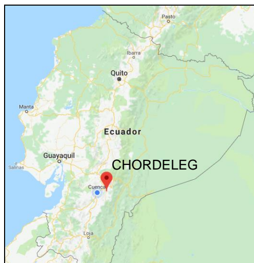
Figura 2. Ubicación geográfica Cantón Chordeleg.

Este trabajo se realizó en el municipio de Chordeleg, ubicado al sur de Ecuador a 463 km de la capital, Quito. La ubicación geográfica del cantón objeto de estudio se puede visualizar en la Figura 2 . Chordeleg tiene una población de aproximadamente 12700 habitantes y una superficie de 104,7 km 2 . (GAD Chordeleg, 2010).