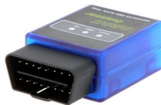
Figura 3. Lector de OBDII utilizado para la adquisición de datos.

Las mediciones de campo implicaron el uso de instrumentación y equipos especializados, los que permitieron determinar el consumo de combustible, el desgaste de los neumáticos, la distancia recorrida por las unidades y el número de pasajeros. Para medir los datos de distancia, trayectos y consumo de combustible se utilizó un lector de diagnóstico a bordo con protocolo (OBDII), que incorpora un GPS. Este dispositivo se colocó en una muestra de tres taxis del cantón, los cuales estuvieron instrumentados durante un periodo de dos meses, obteniendo de esa manera más de 3000 viajes que fueron procesados para el estudio. El equipo utilizado como se muestra en la Figura 3 es un data logger OBDII que se lo calibró para que pueda grabar datos a 1 Hz.