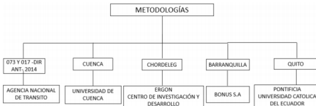
Figura 1. Estudios de tarifas locales

Un proceso de asignación de costos será la herramienta fundamental que permitirá determinar el costo de las variables que conforman la tarifa. La correcta recolección de la