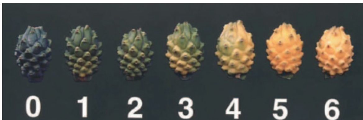
Figura 1. Tabla de color de pitahaya amarilla, según la Norma Técnica Colombiana NTC- 3554,1996

Se colectaron 15 frutos en cada estado para registrar las variables peso fresco (g), mientras que para las variables de porcentaje de pulpa y cáscara, firmeza de la pulpa (N), sólidos solubles ( ^{\circ} Brix), pH, acidez (%) y evaluación sensorial se tomaron 15 frutos del estado 0 y 6, respectivamente. El peso fresco se registró utilizando una balanza digital (Citizen Scale, modelo CG 4102C; precisión de 0.01 g). La firmeza se determinó con un penetrómetro manual (Force Gauge, modelo GY-4) provisto con un puntal de 3.50 mm de diámetro, realizando dos lecturas en la parte ecuatorial del fruto, y los resultados se expresaron en Newtons (N). El contenido de sólidos solubles totales ( ^{\circ} Brix) se midió utilizando un refractómetro digital (Hanna instruments, modelo Hi 96801, USA), el pH con un potenciómetro (BOECO, modelo PT-380) y la acidez titulable (expresada como % ácido cítrico); todas las variables se midieron con la metodología descrita por la AOAC (2012).